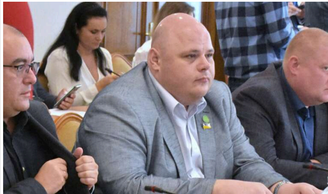
Микола Стефанчук заявив, що вибори президента відбудуться через 6-9 місяців, але потім спростував це

Брат голови Верховної Ради, народний депутат від «Слуги народу» Микола Стефанчук вважає, що президентські вибори відбудуться вже наступного року, а Росія поверне Україні всі території. Такий коментар він надав журналістам польського видання Onet.