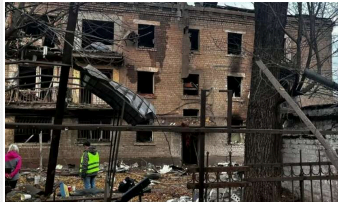
У Дніпропетровській ОВА розповіли про стан постраждалих після ракетного удару окупантів

Внаслідок ракетного удару по Кривому Розу 28 жовтня постраждало 14 осіб. Наразі в стаціонарі перебувають вісім пацієнтів, за життя однієї людини продовжують боротися лікарі.