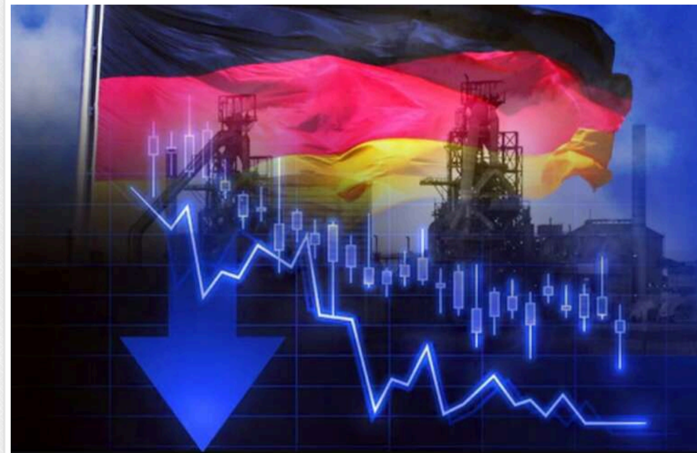
Німеччині потрібні реформи та інвестиції для виходу з рецесії, – МВФ

Німеччині потрібні як структурні реформи, так і більші інвестиції в державну інфраструктуру для подолання рецесії, заявив європейський директор Міжнародного валютного фонду Альфред Каммер.