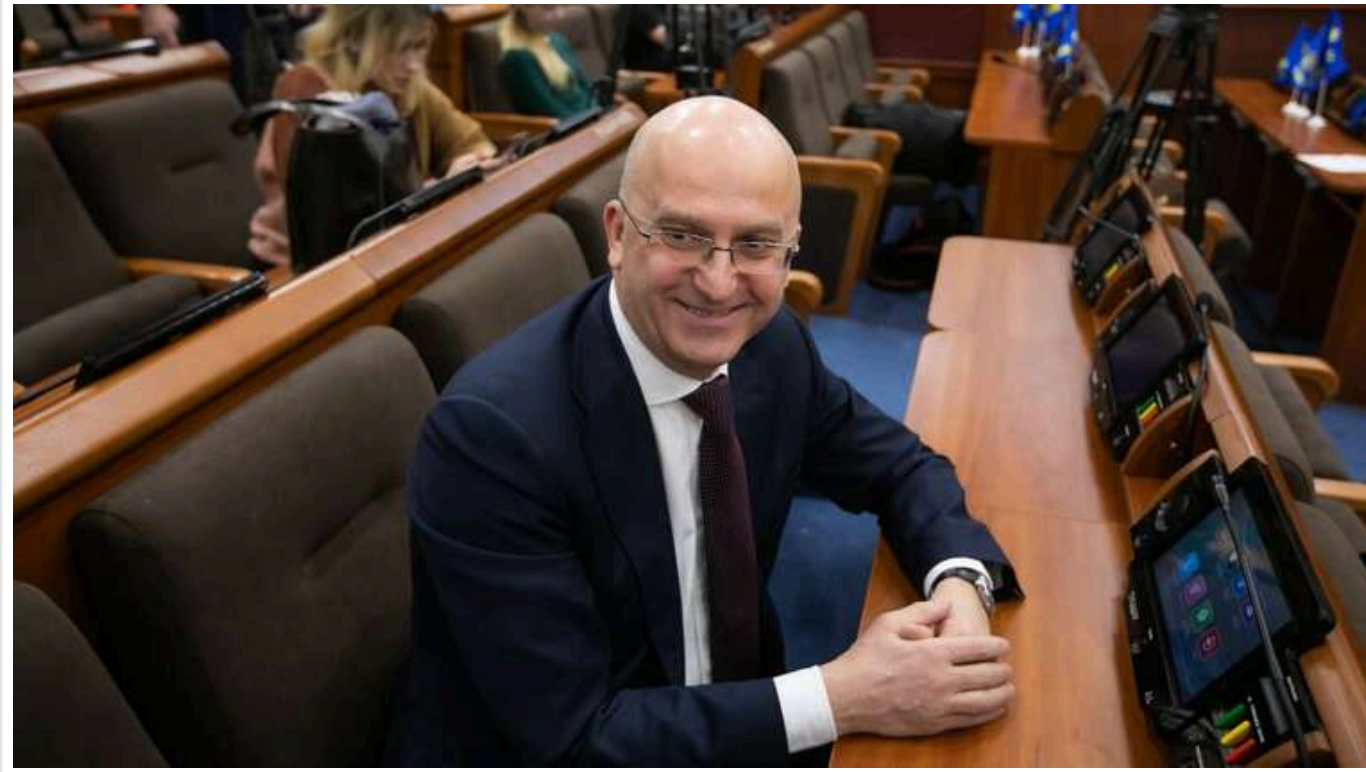
Стала відома причина смерті депутата від "Голосу" Олега Макарова

За інформацією ЗМІ, причиною смерті депутата з «Голосу» Олега Макарова стала онкологія.