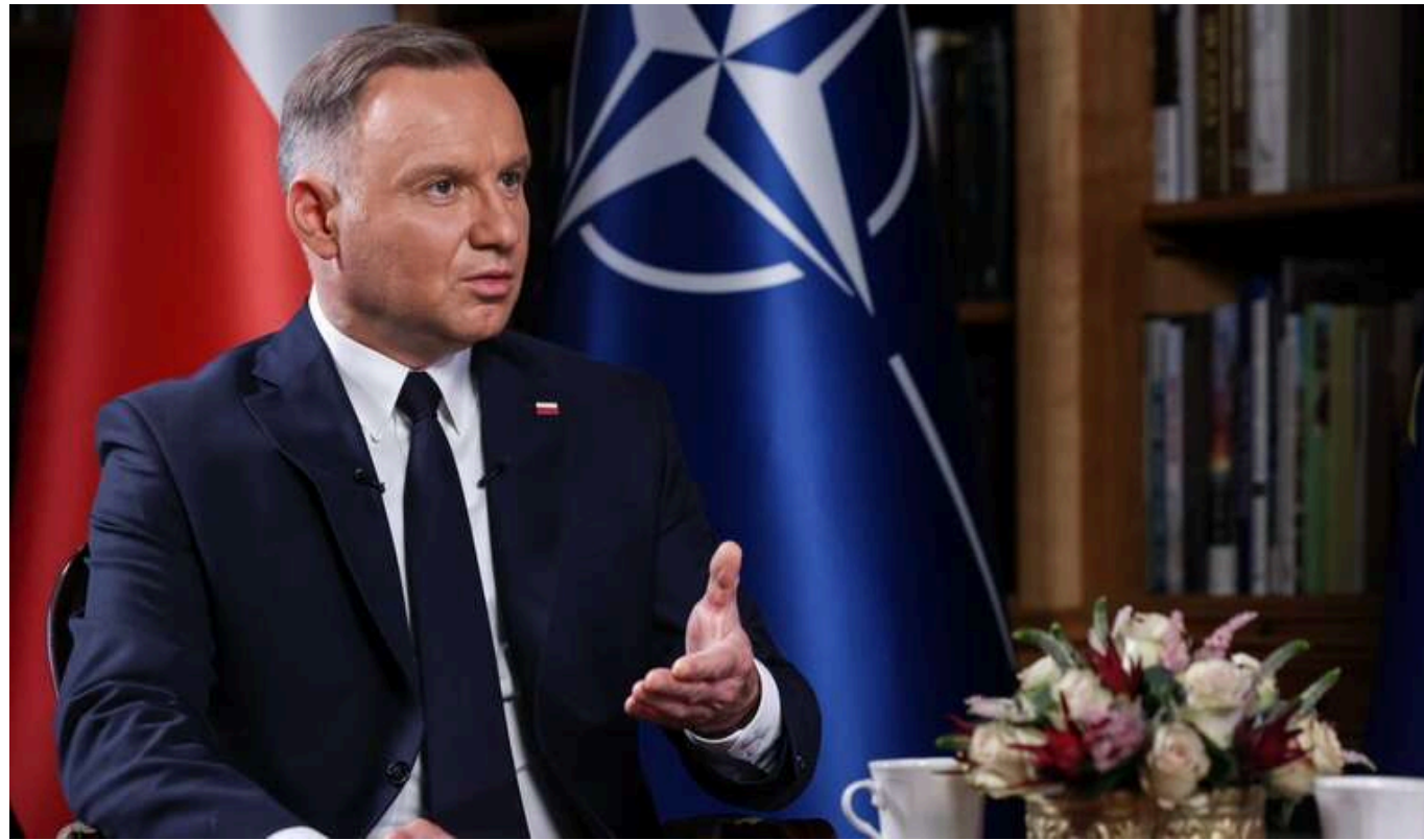
Зеленський не показав Польщі таємні додатки до свого Плану перемоги

Про це польський президент Дуда розповів в інтерв'ю радіостанції Radio Zet.