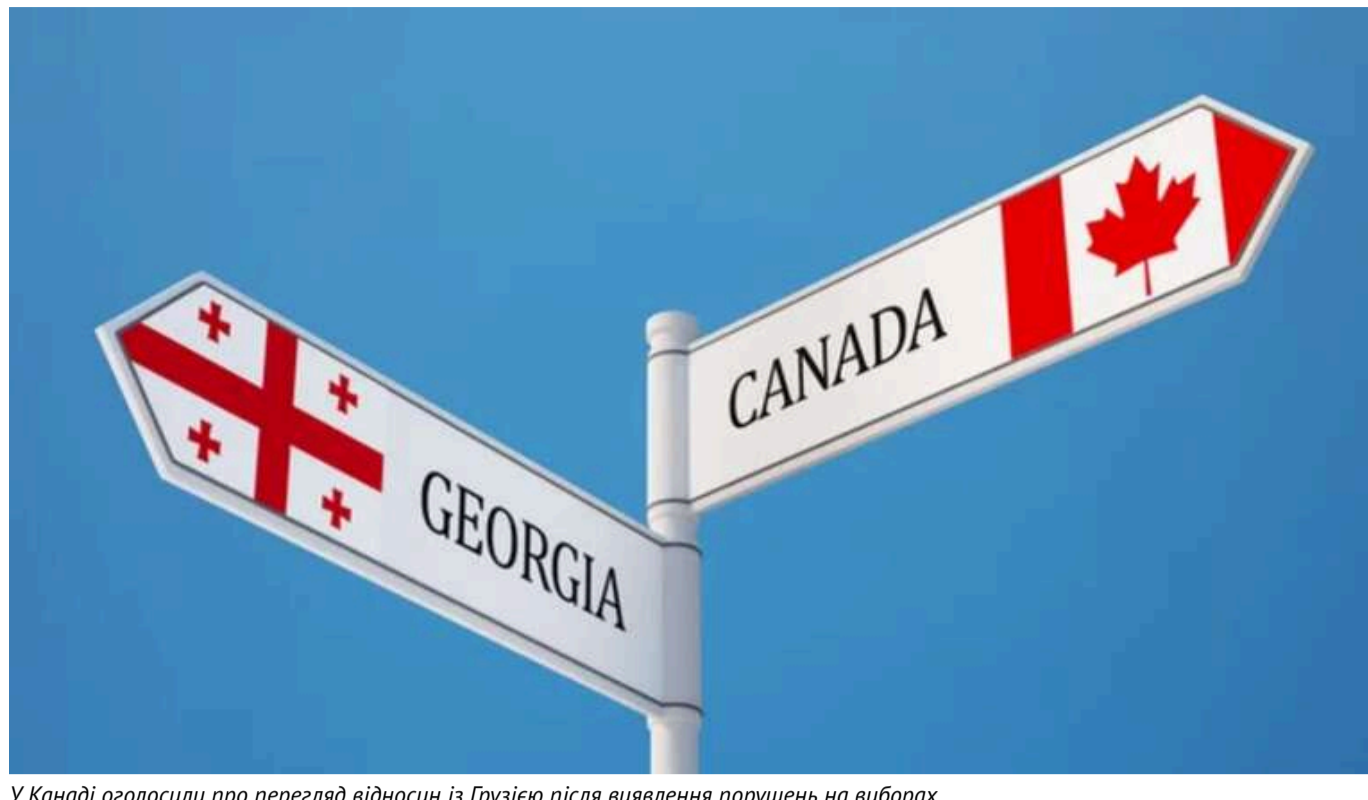
У Канаді оголосили про перегляд відносин із Грузією після виявлення порушень на виборах

Канада оголосила про перегляд своїх відносин із урядом Грузії. У країні висловили тривогу через повідомлення спостерігачів про численні порушення під час парламентських виборів 26 жовтня.