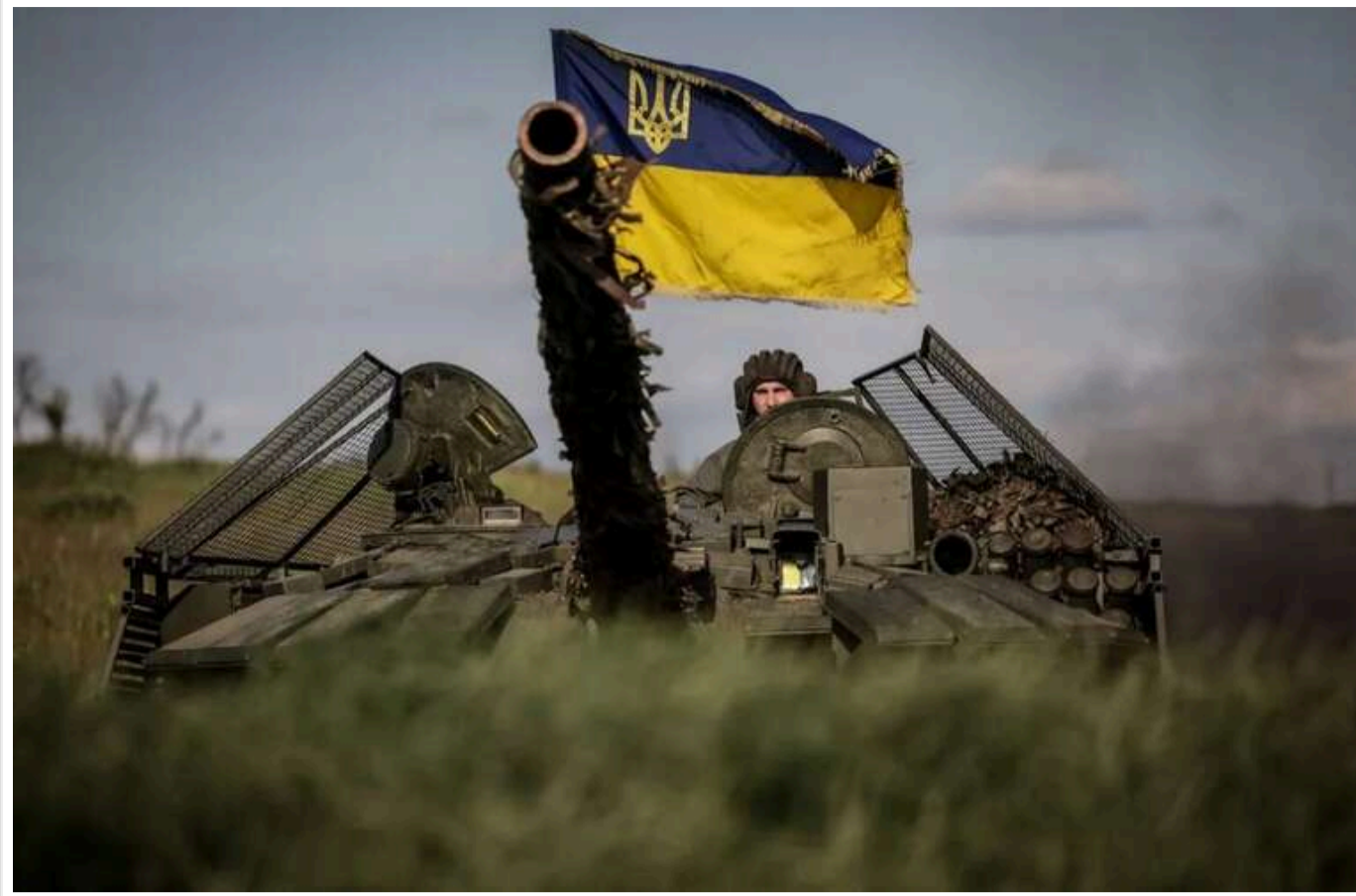
Втрати ворога: Сили оборони знешкодили ще 1360 окупантів та 72 Бпла

Сили оборони за минулу добу відмінусували 1 360 російських окупантів, спалили 9 танків та 45 артилерійських систем.