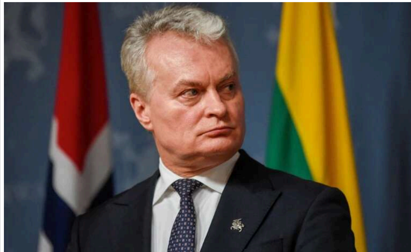
Президент Литви Науседа розповів, як Альянс має відреагувати на війська КНДР у Росії

Президент Литви Гітанас Науседа описав, якою повинна бути реакція НАТО на розгортання північнокорейських військ на території РФ та їх можливе залучення до війни проти України.