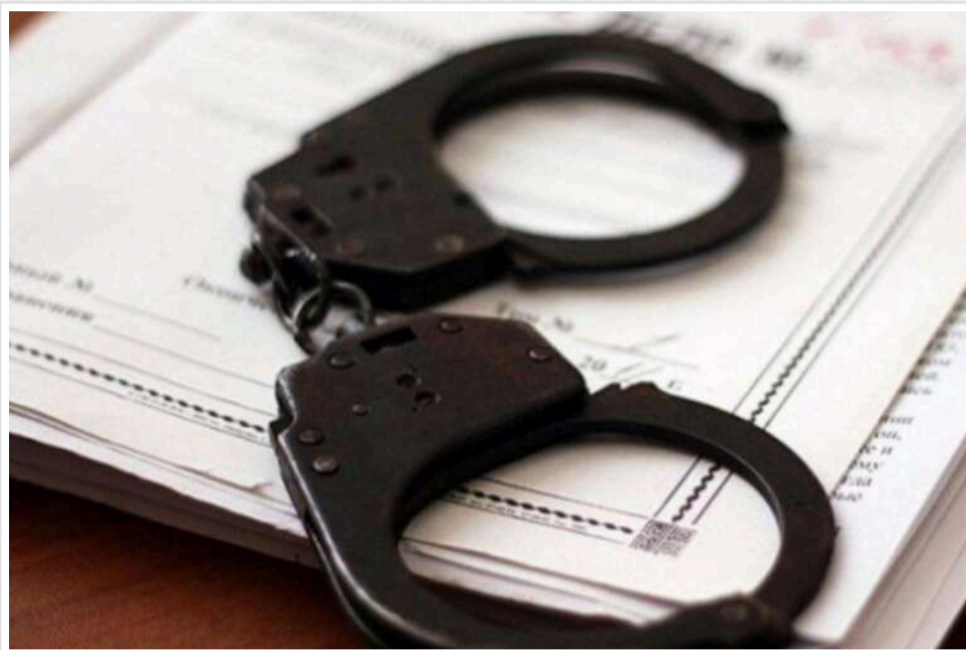
СБУ висунула підозру «реконструктору» із Лисичанська за співпрацю з російськими загарбниками

Служба безпеки України заочно оголосила про підозру в співпраці з РФ пропагандисту з Лисичанська Луганської області.