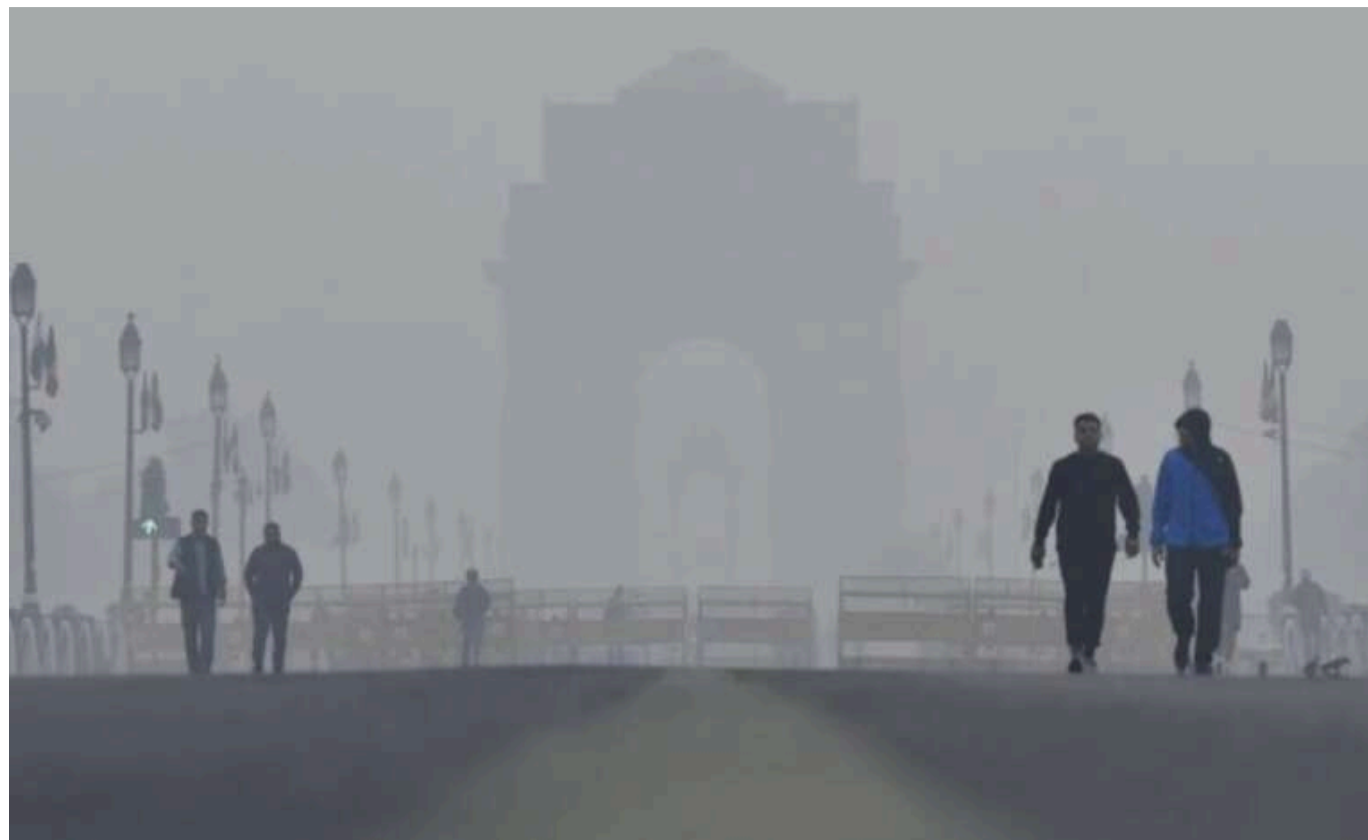
В індійській столиці рівень забруднення повітря перевищував допустимі норми ВООЗ у 30 разів

У столиці Індії Нью-Делі рівень забруднення повітря в 25-30 разів перевищував рекомендований рівень Всесвітньої організації охорони здоров'я (ВООЗ).