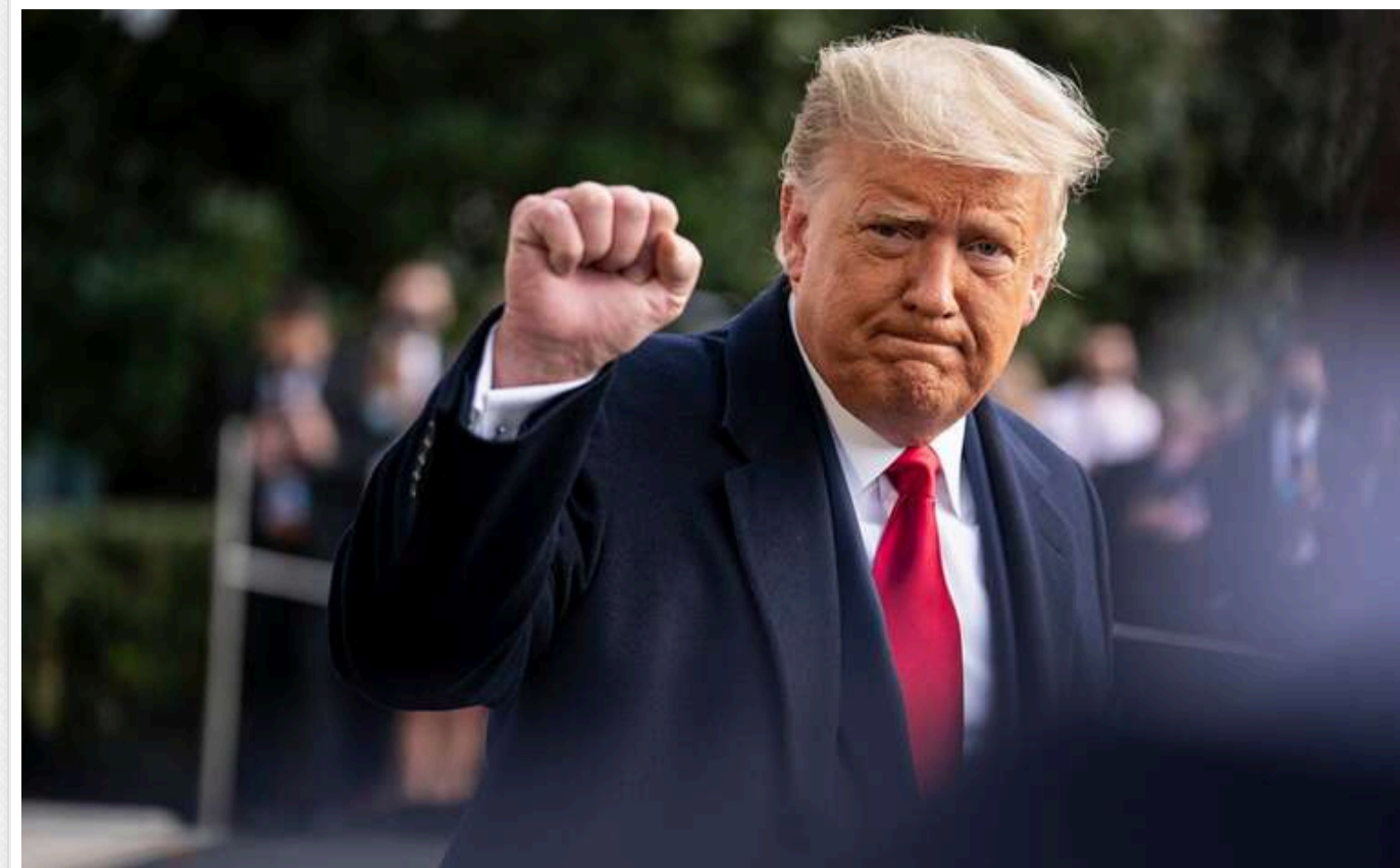
Трам, якщо виграє вибори, планує закінчити війну в Україні, але Європа буде відповідальна за гарантії безпеки, - ЗМІ

У разі перемоги Трамп планує "діяти зі запаморочливою швидкістю", щоб закінчити війну в Україні на лінії фронту, однак надання гарантій безпеки для Києва він залишить на розсуд Європи.