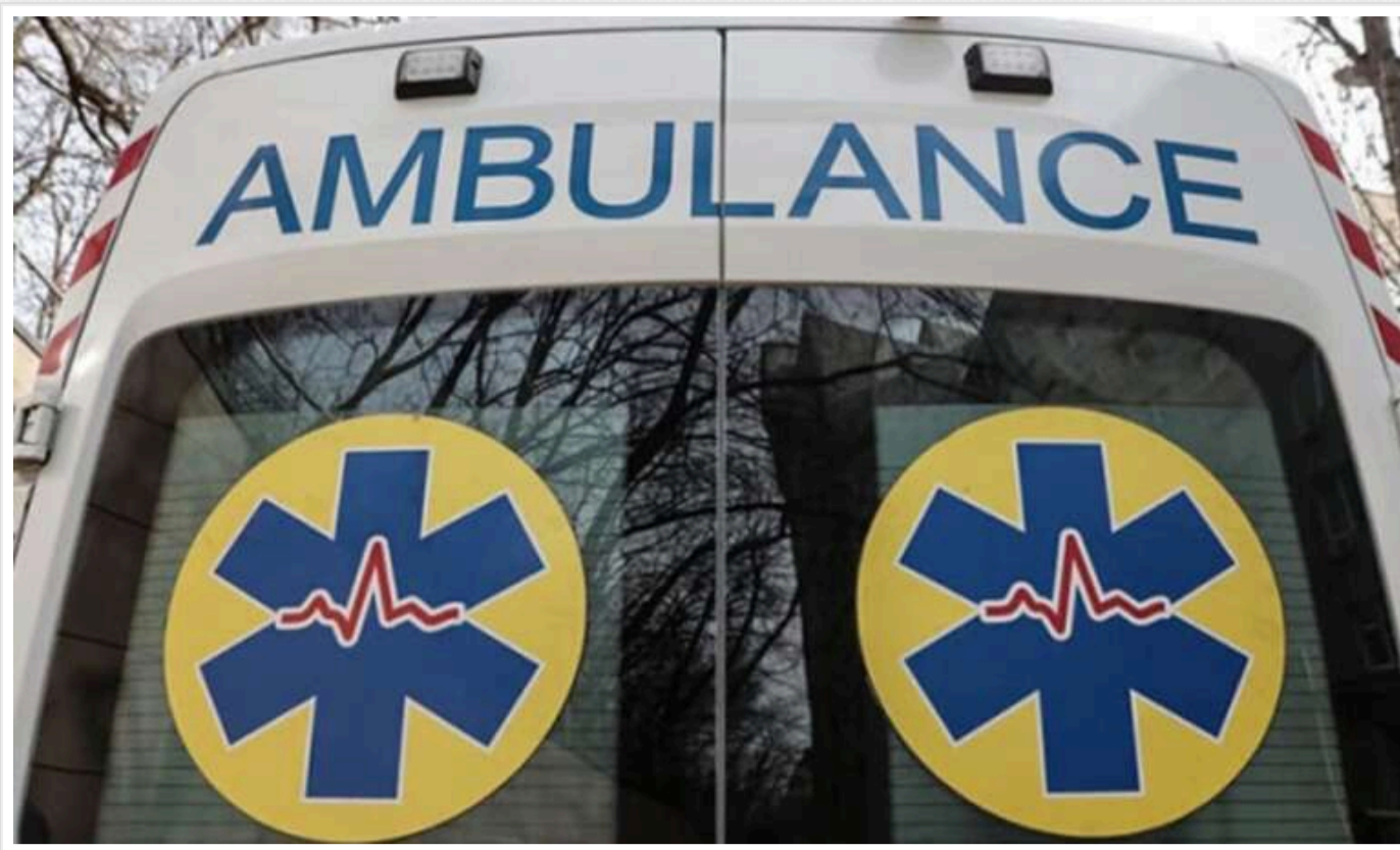
Окупанти на Херсонщині обстріляли цивільну автівку: є поранений

Російські війська обстріляли цивільний автомобіль у селищі Білозерка на Херсонщині, поранено 35-річного водія.