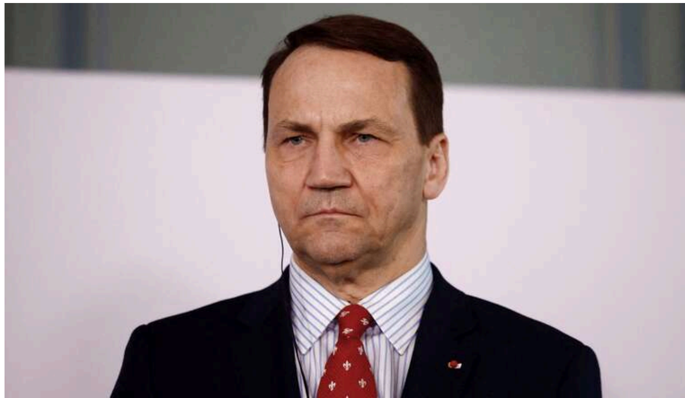
Сікорський: Захід не хоче миру через капітуляцію України

Захід не прагне миру через капітуляцію України, адже це не буде справжнім миром. Захід прагне миру, заснованого на повазі до верховенства права, прав людини та права нації на самовизначення.