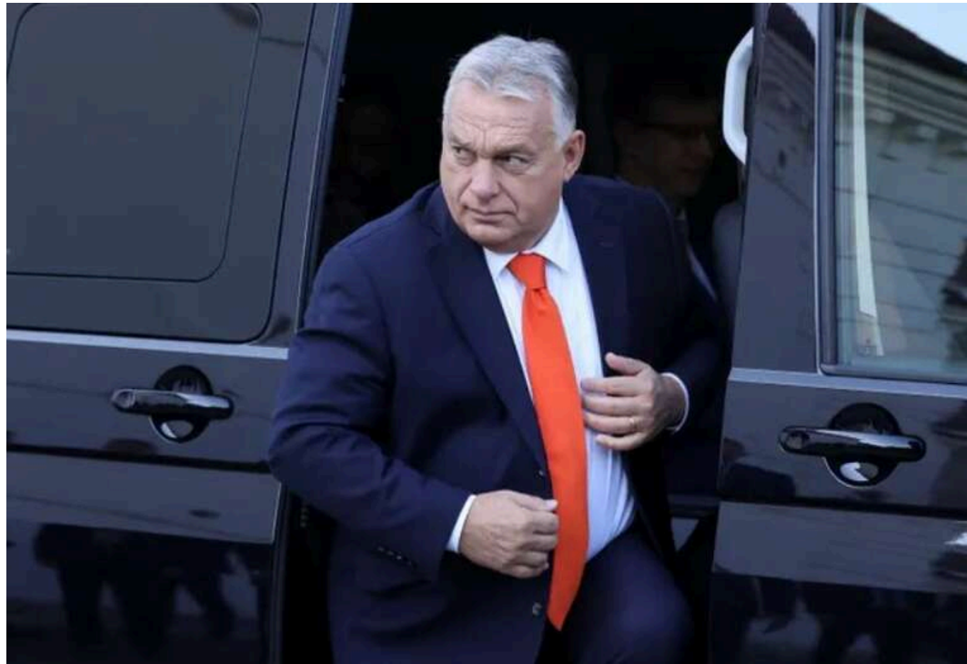
Прем'єр Угорщини поїхав до Грузії без мандата від ЄС - Єврокомісія

Прем'єр-міністр Угорщини Віктор Орбан, який сьогодні вирушив до Тбілісі на тлі суперечливих даних про результати парламентських виборів у цій країні, здійснює цей візит за власною ініціативою та виключно в рамках двосторонніх відносин між Угорщиною і Грузією, оскільки не отримував від ЄС жодного мандата на представлення там загальноєвропейської позиції.