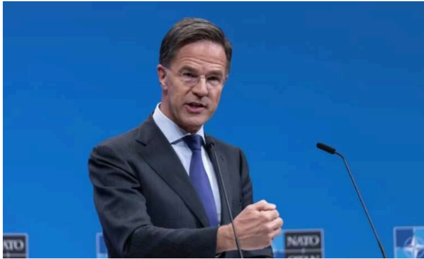
Генсек НАТО підтвердив наявність солдатів КНДР у Курській області Росії

Генеральний секретар НАТО Марк Рютте повідомив, що за останньою доступною інформацією він може підтвердити, що військові Північної Кореї вже залучені у Курській області РФ.