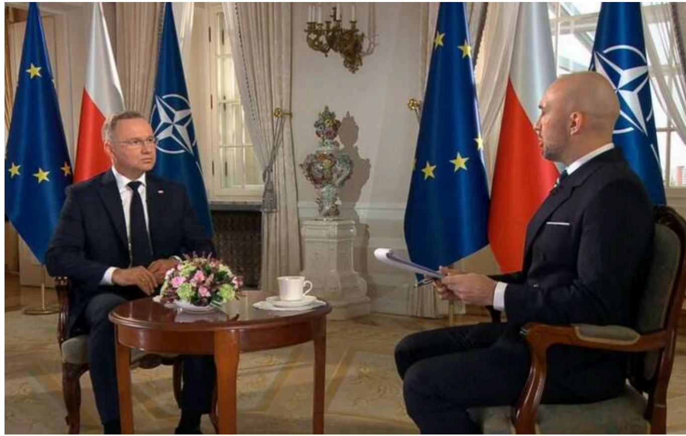
Віддайте Путіну частину своїх територій, - Дуда лідерам європейських країн

Президент Польщі Анджей Дуда запропонував представникам західних країн, які радять Україні відмовитися від окупованих територій, віддати Росії частину своїх земель.