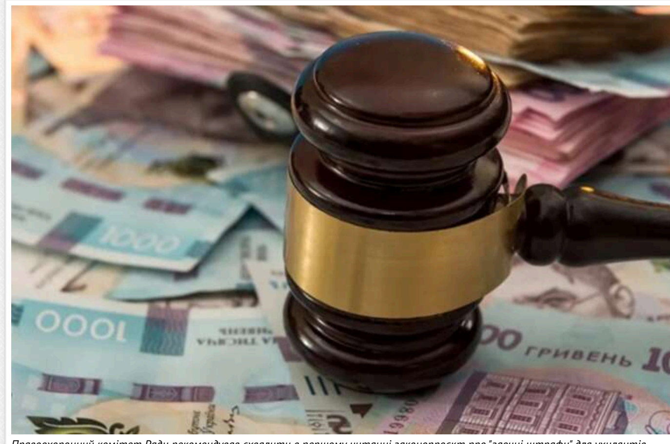
Правоохоронний комітет Ради рекомендував схвалити в першому читанні законопроект про "заочні штрафи" для ухилиянтів