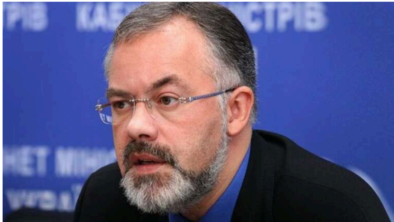
Дмитро Табачник продовжує керувати вітчизняною освітою?