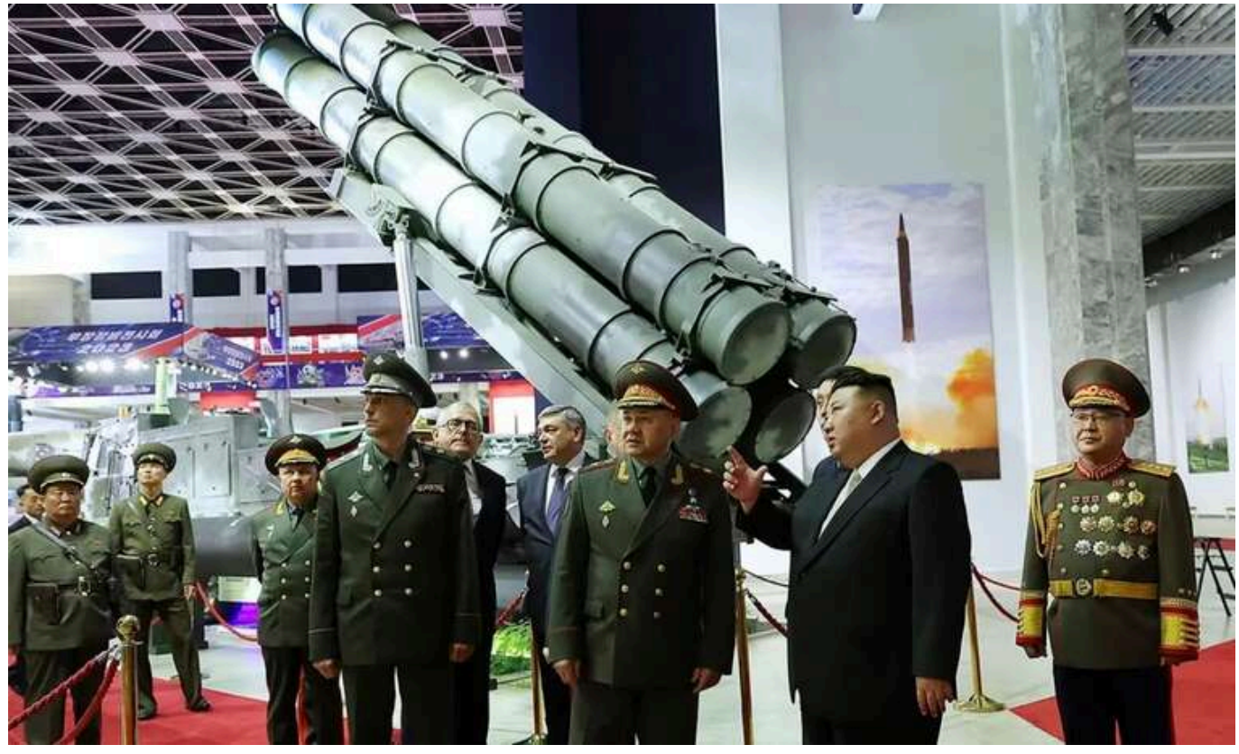
Північна Корея могла отримати від РФ до 5,5 мільярда доларів за озброєння

Північна Корея могла поставити Росії озброєння на суму до 5,5 мільярда доларів.