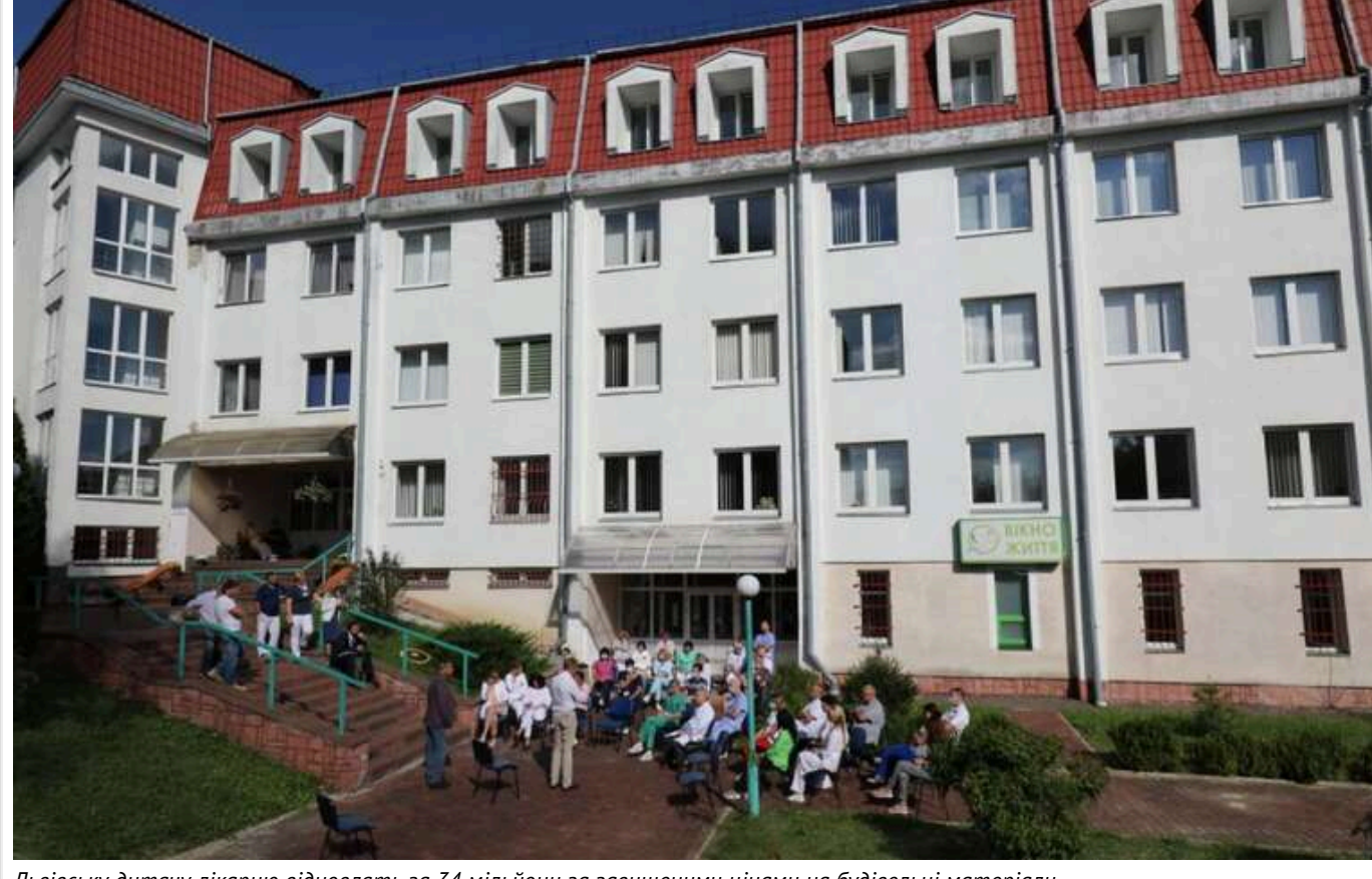
Львівську дитячу лікарню відновлять за 34 мільйони за завищеними цінами на будівельні матеріали

КНП «Львівське територіальне медичне об'єднання «Багатопрофільна клінічна лікарня інтенсивних методів лікування та швидкої медичної допомоги» 23 жовтня провело тендер і уклало договір із ТОВ «Сервіскотломонтаж-Львів» на реконструкцію будівлі лікарні на суму 37,87 млн грн.