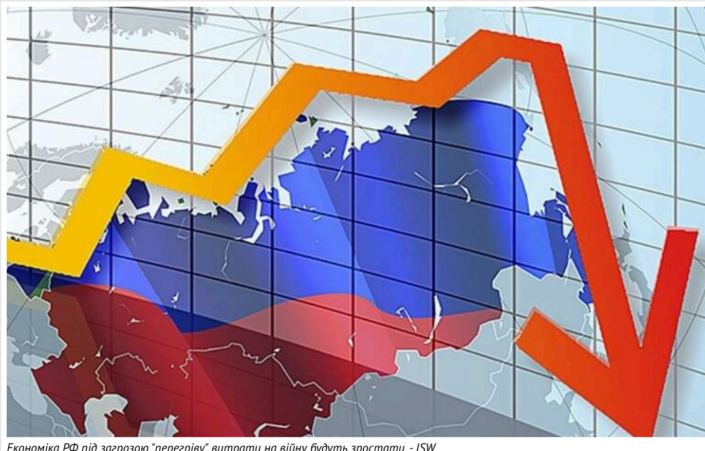
Економіка РФ під загрозою "перегріву", витрати на війну будуть зростати, - ISW

Російська економіка - під загрозою "перегріву" через занадто великі витрати на війну проти України. В таких умовах російські компанії змушені штучно піднімати зарплати, аби задовольнити попит на робочу силу, залишаючись конкурентоспроможними з високими зарплатами в окупайній армії.