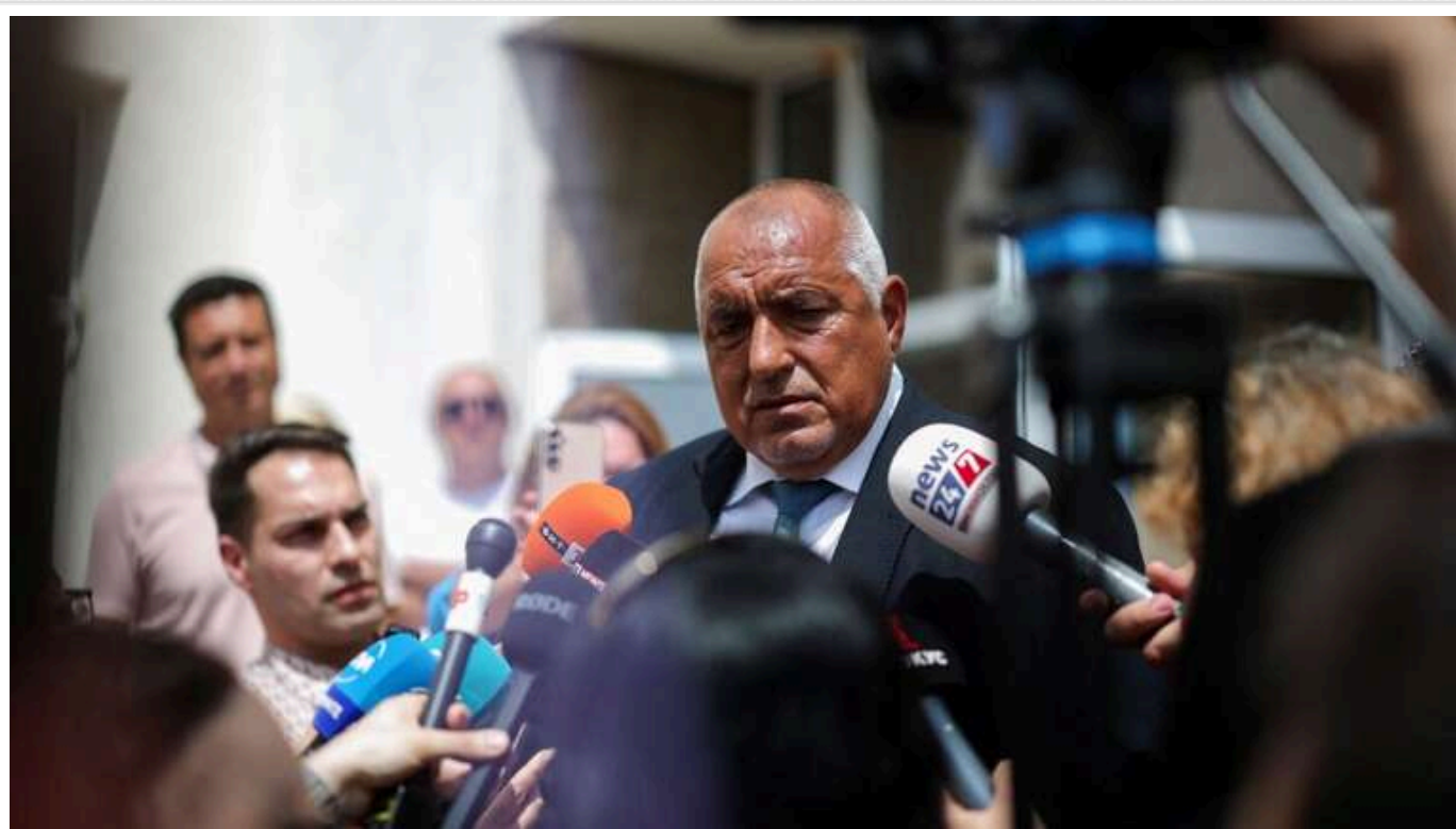
У Болгарії на виборах перемагає партія експрем'єра Борисова

На дострокових парламентських виборах у Болгарії лідирує правоцентристська партія ГЕРБ колишнього прем'єр-міністра Бойка Борисова.