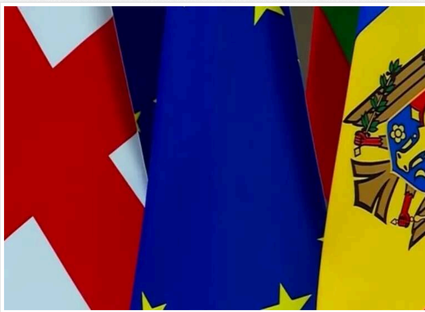
Москва використала "гібридні" методи впливу на вибори в Грузії та Молдові, - ISW

Російська влада планує відновити свої зусилля щодо здобуття контролю над пострадянським простором, використовуючи поточні вибори в Молдові та Грузії. Зокрема, Кремль намагається отримати вигоду від цих політичних процесів для досягнення своїх цілей в Україні, проти якої веде війну, та інших регіонах колишнього СРСР.