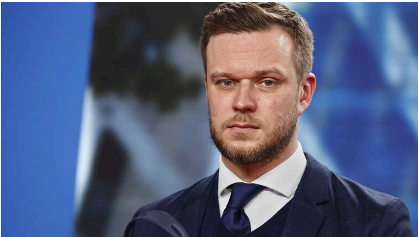
Глава МЗС Литви після виборів йде з посади лідера партії

Міністр закордонних справ Литви Габрієлус Ландсбергіс повідомив, що після поразки на виборах залишає посаду керівника своєї партії.