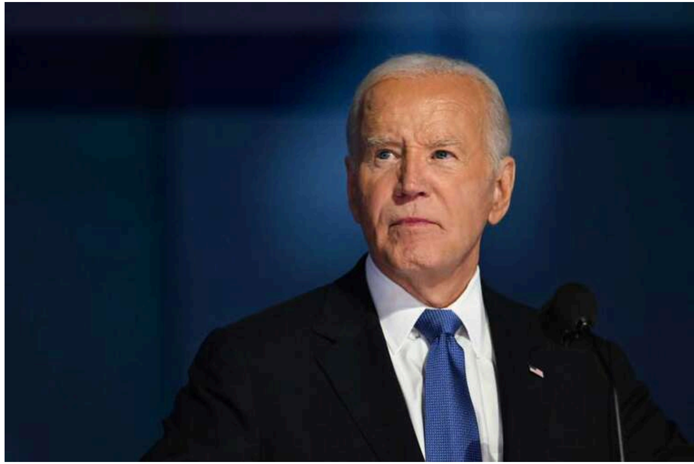
Сьогодні Джо Байден достроково проголосує на президентських виборах у США

Президент США Джо Байден проголосує достроково на цьогорічних виборах у понеділок, 28 жовтня.