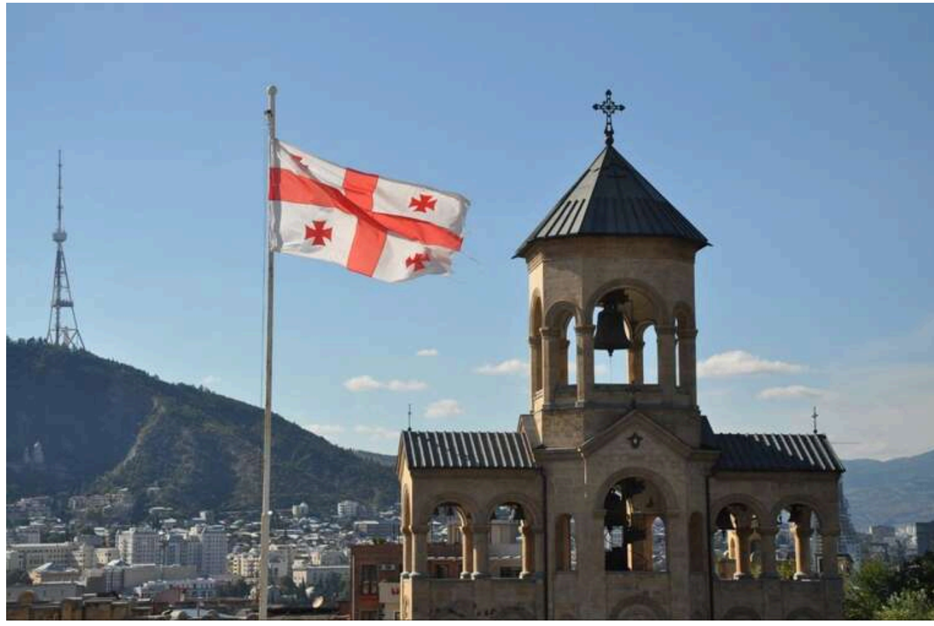
У Польщі заявили, що ситуація з виборами в Грузії віддаляє її від Євросоюзу та НАТО

Міністерство закордонних справ Польщі висловило глибоку стурбованість ходом виборів до грузинського парламенту, підкресливши, що ситуація з їх проведенням віддаляє Тбілісі від ЄС та НАТО.