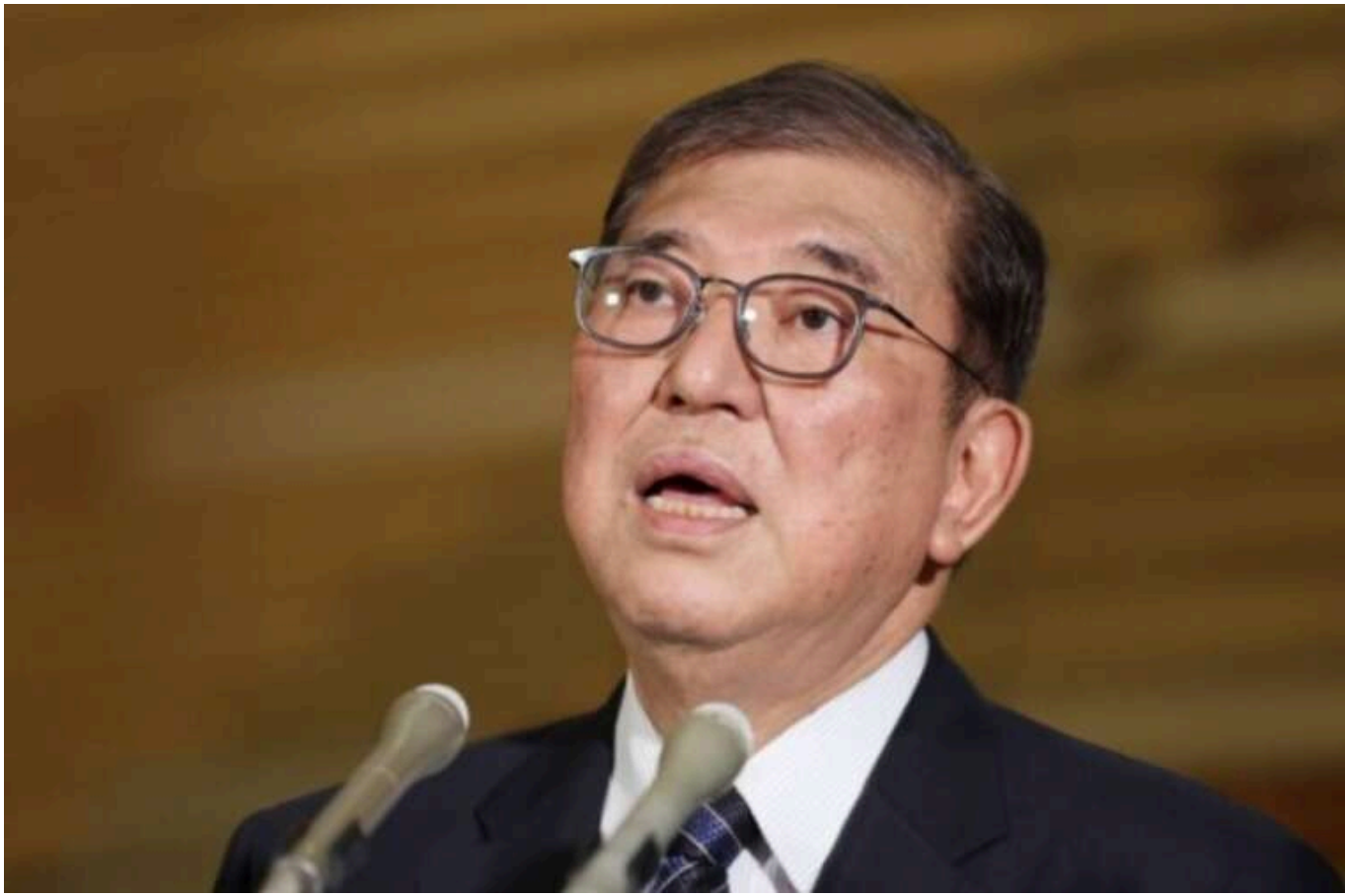
В Японії правляча коаліція втратила більшість у нижній палаті парламенту, - AP

Під час парламентських виборів у неділю, 28 жовтня, правляча коаліція прем'єр-міністра Японії Сігею Ісіби втратила більшість у нижній палаті парламенту, що складається з 465 місць, через обурення виборців фінансовими скандалами, пов'язаними з правлячою партією.