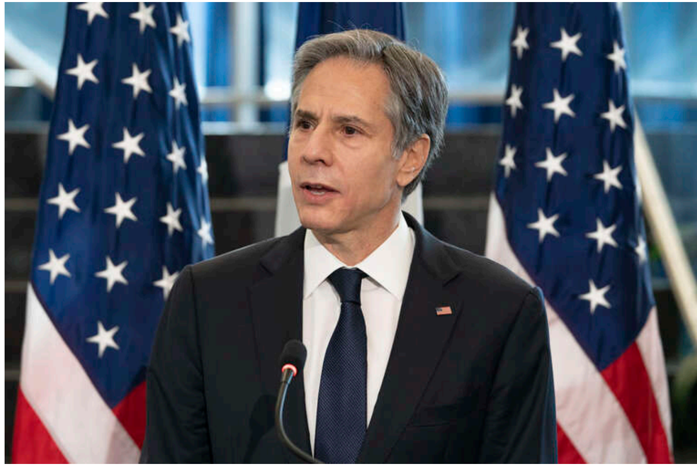
США наполягають на розслідуванні порушень під час виборів у Грузії, - Блінкен

Вашингтон закликає Тбілісі провести всебічне розслідування даних і повідомлень про порушення, пов'язаних із парламентськими виборами в Грузії 26 жовтня. США спонукають політичних лідерів країни усунути недоліки у виборчому процесі.