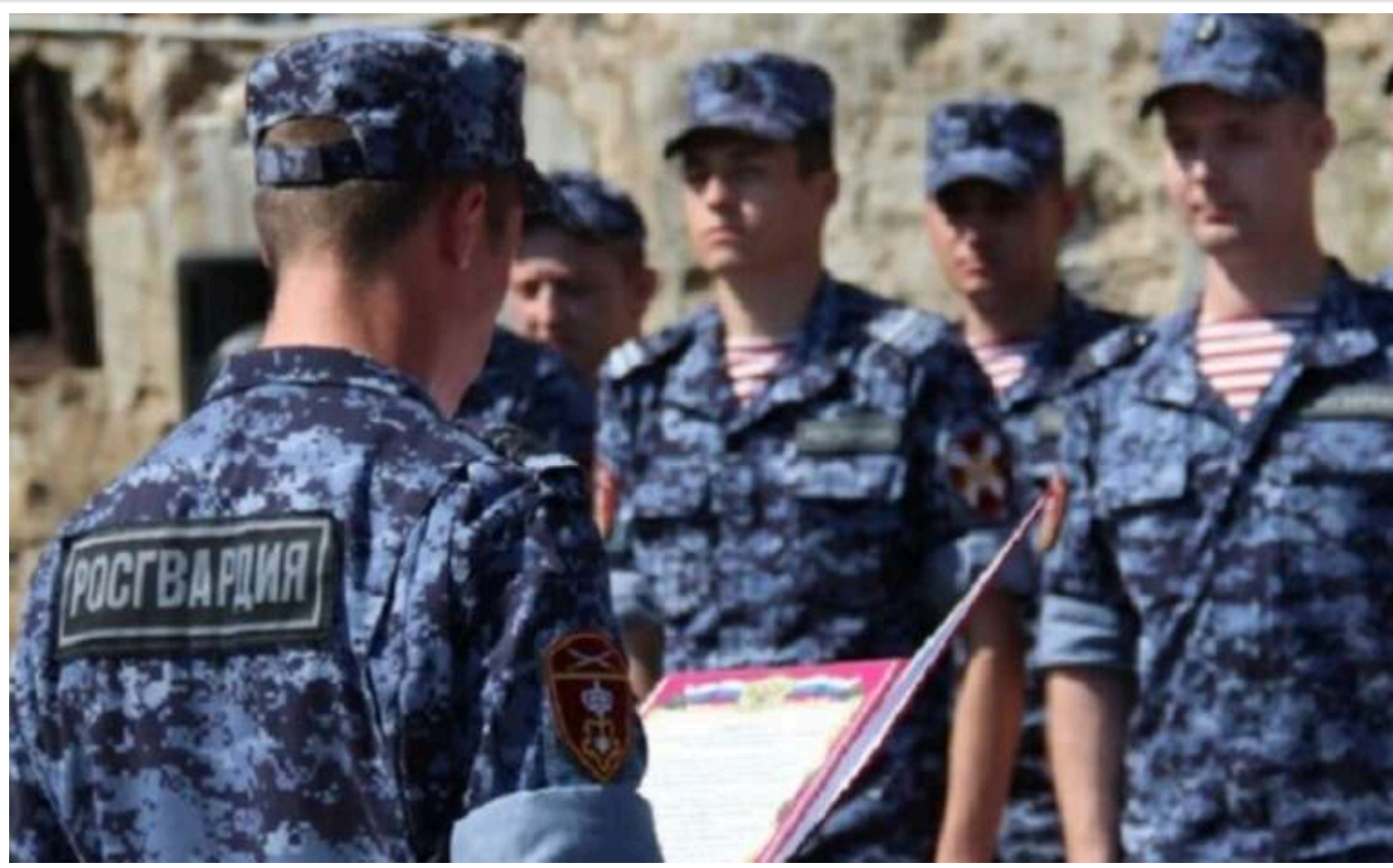
На тимчасово окупованій Луганщині в силових структурах зростає кількість працівників із РФ

На тимчасово окупованих територіях Луганщини за два роки відсоток місцевих співробітників силових відомств зменшився, натомість залучають приїжджих з Росії.