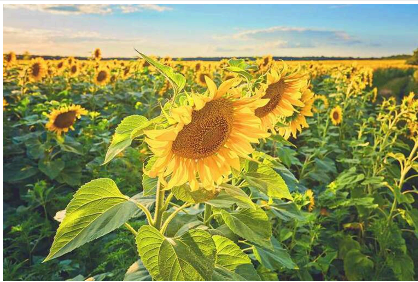
Загарбники мають намір вивезти понад 300 тонн соняшнику з окупованої Луганщини, - ЦНС

Російські загарбники планують вивезти з тимчасово окупованої Луганської області понад 300 тонн соняшнику, який "закупили" в місцевих аграріїв за заниженими цінами.