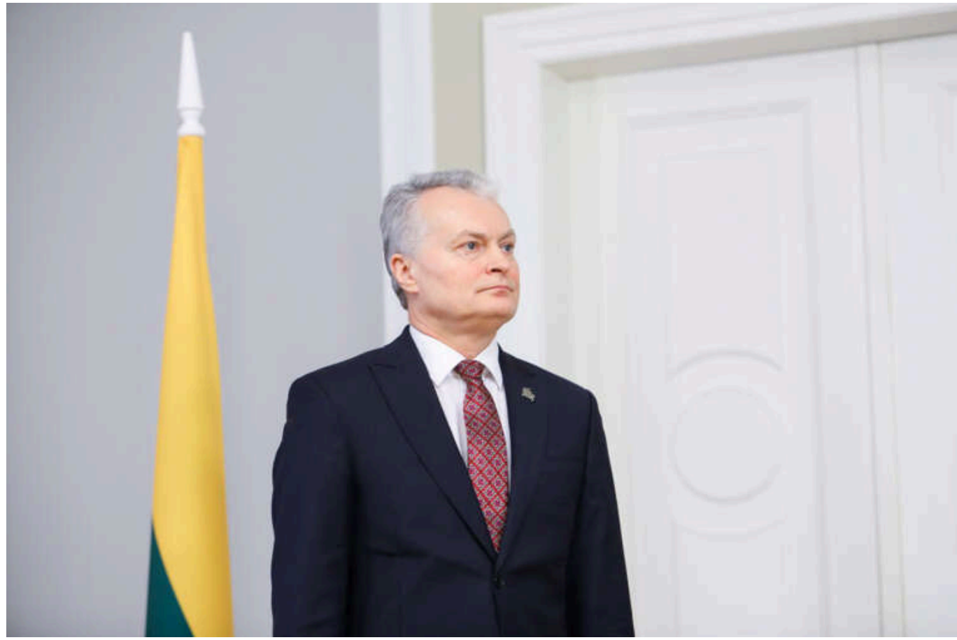
Результати виборів у Грузії несумісні зі зближенням із ЄС, - Науседа

Президент Литви Гітанас Науседа заявив після парламентських виборів у Грузії, що Грузія віддаляється від можливого членства в Євросоюзі.