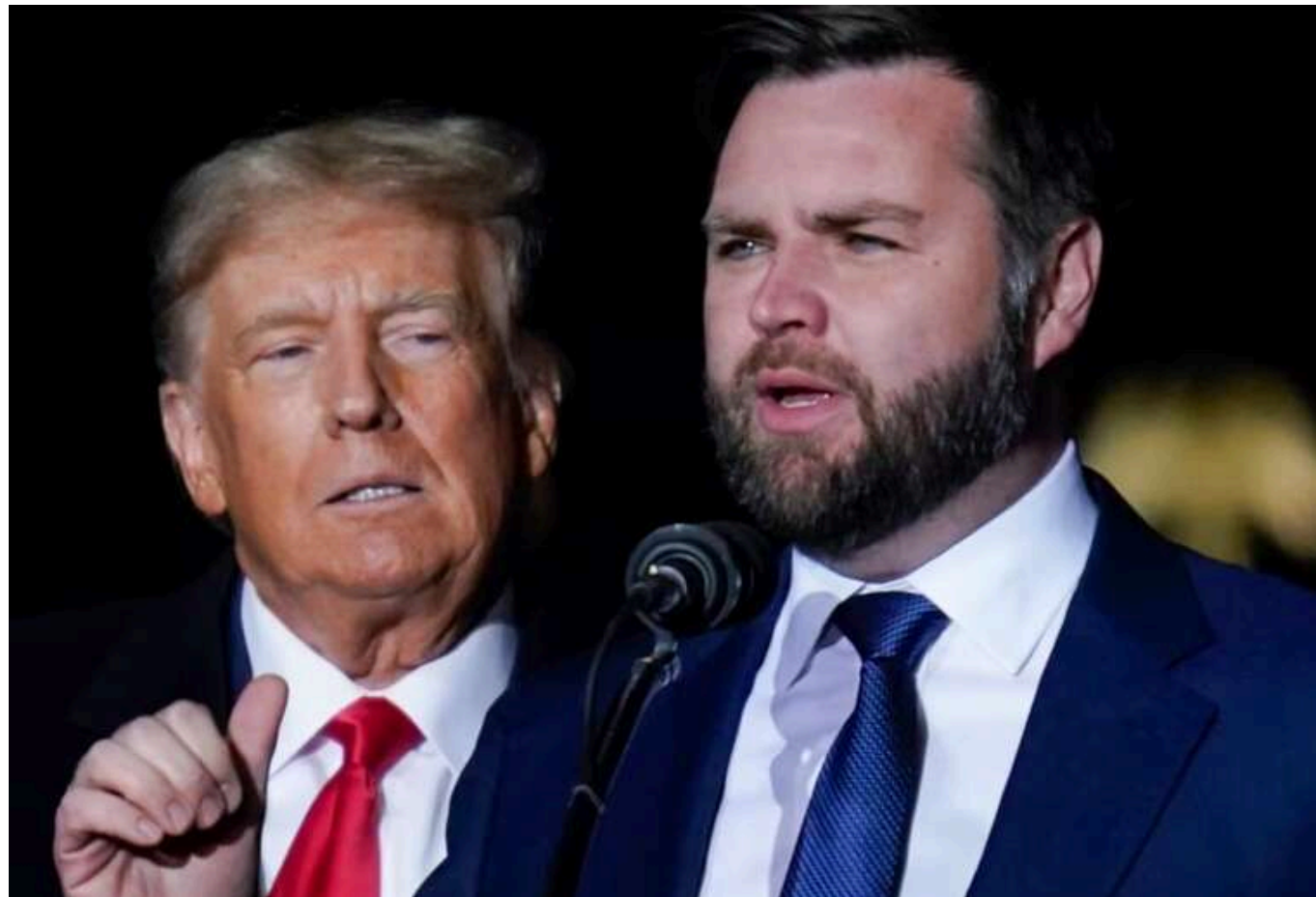
Трамп залишить США в НАТО, - Ді Венс

Кандидат на посаду віцепрезидента США від Республіканської партії Джей Ді Венс заявив, що Дональд Трамп у разі обрання знову залишиться у складі НАТО, хоча важливо, щоб трансатлантичний альянс не був "просто соціальним клієнтом".