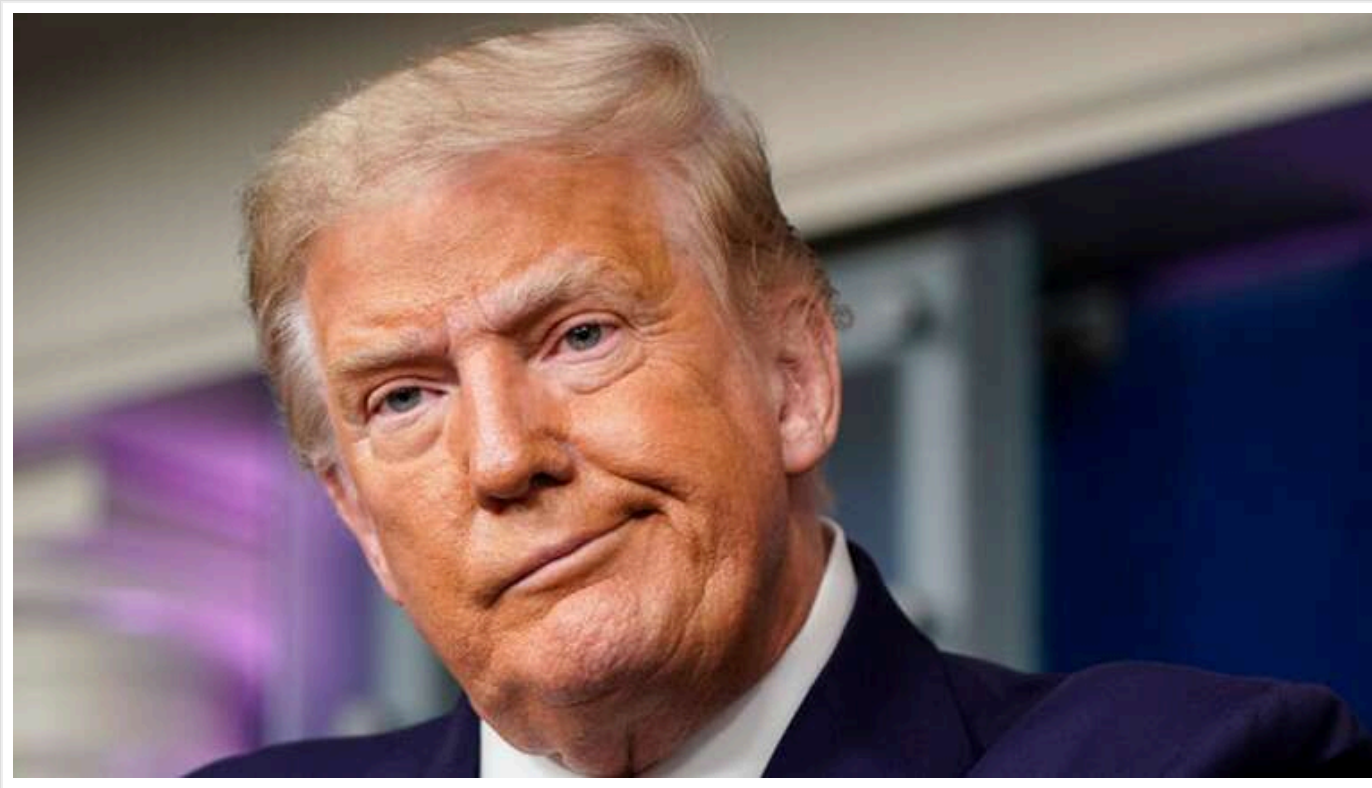
Якщо Трамп здобуде перемогу на виборах, допомога Україні «значно зменшиться»

Однак і Камалі Гарріс буде важко забезпечити значну фінансову допомогу для Києва.