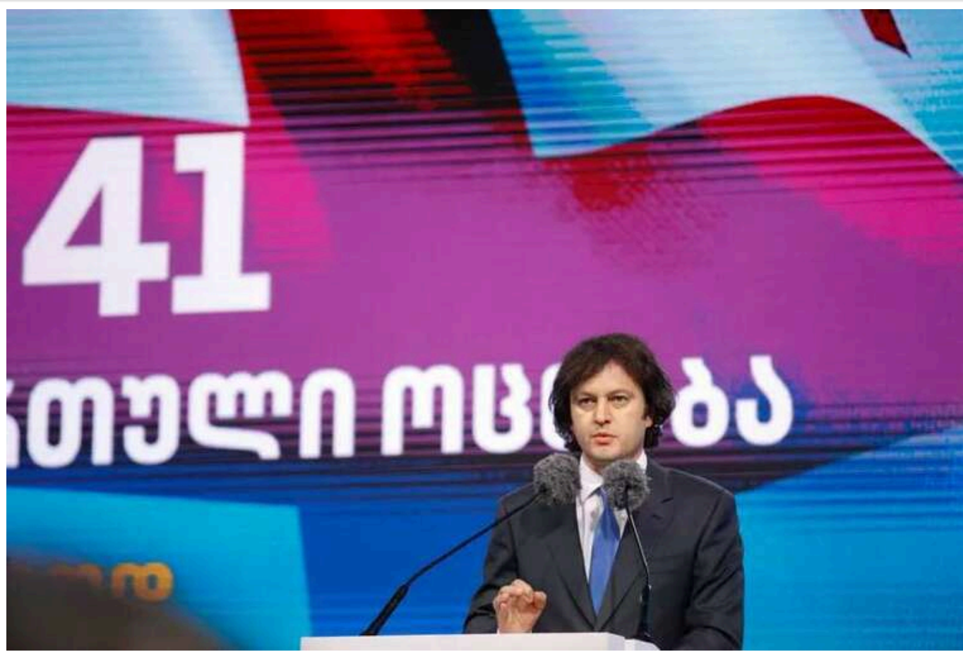
Прем'єр Грузії заявив, що після перемоги на виборах уряд все одно буде затверджено, незважаючи на незгоду опозиції

За словами Іраклія Кобахідзе, засідання уряду пройде у звичному форматі.