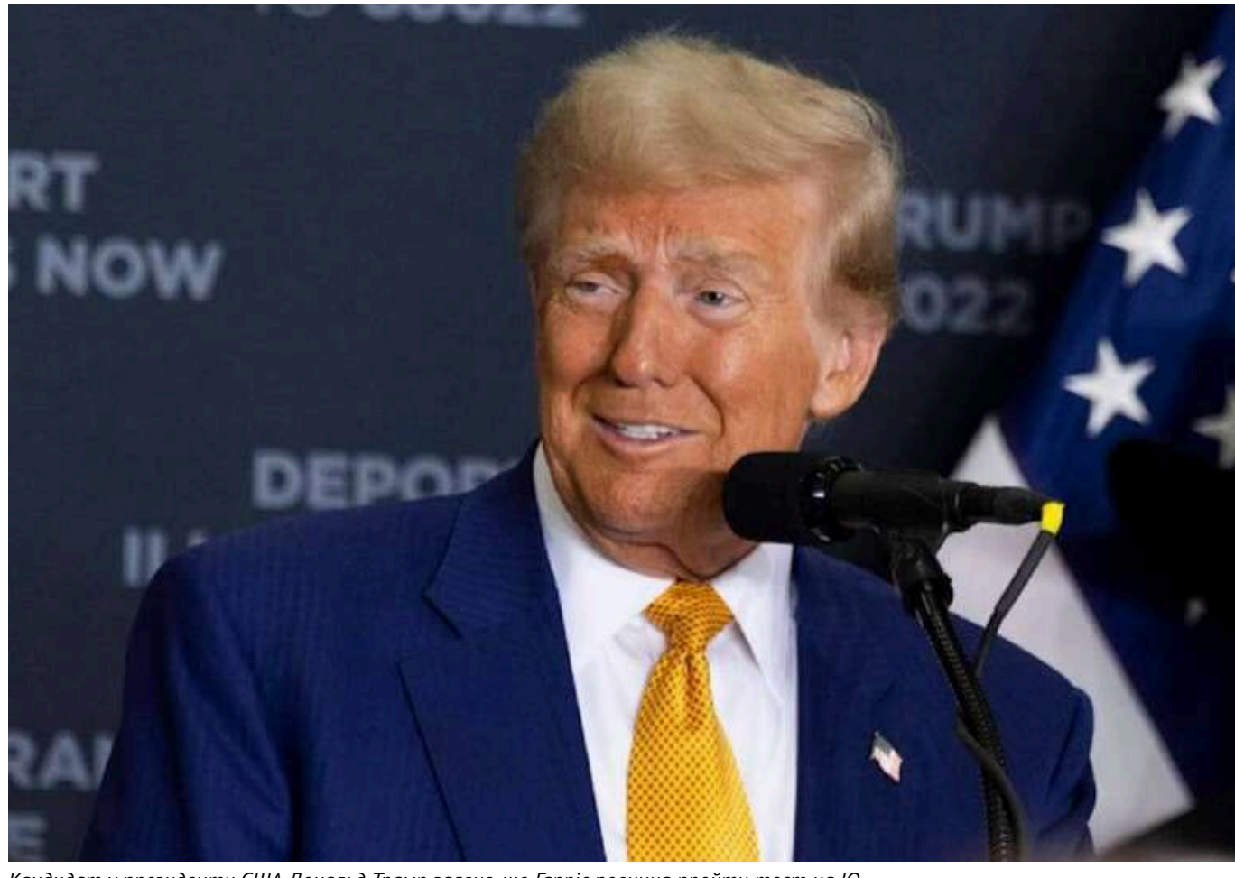
Кандидат у президенти США Дональд Трамп заявив, що Гарріс повинна пройти тест на IQ

Раніше вона назвала кандидата від республіканців фашистом.