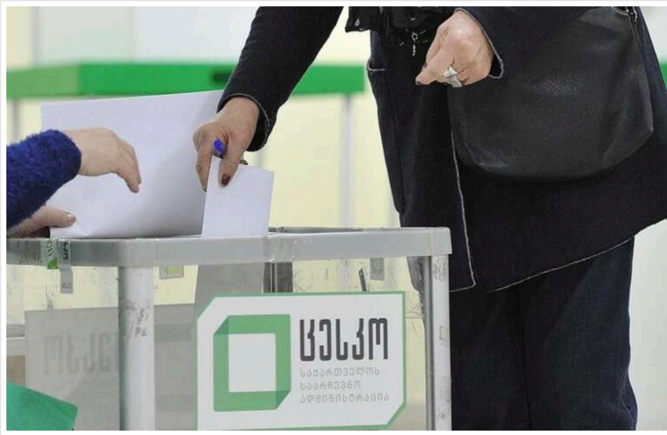
Звіт ОБСЄ про вибори в Грузії не містить даних про "масштабні фальсифікації", про які заявляє опозиція

Документ опублікований на сайті організації, що слідувала за процесом голосування.