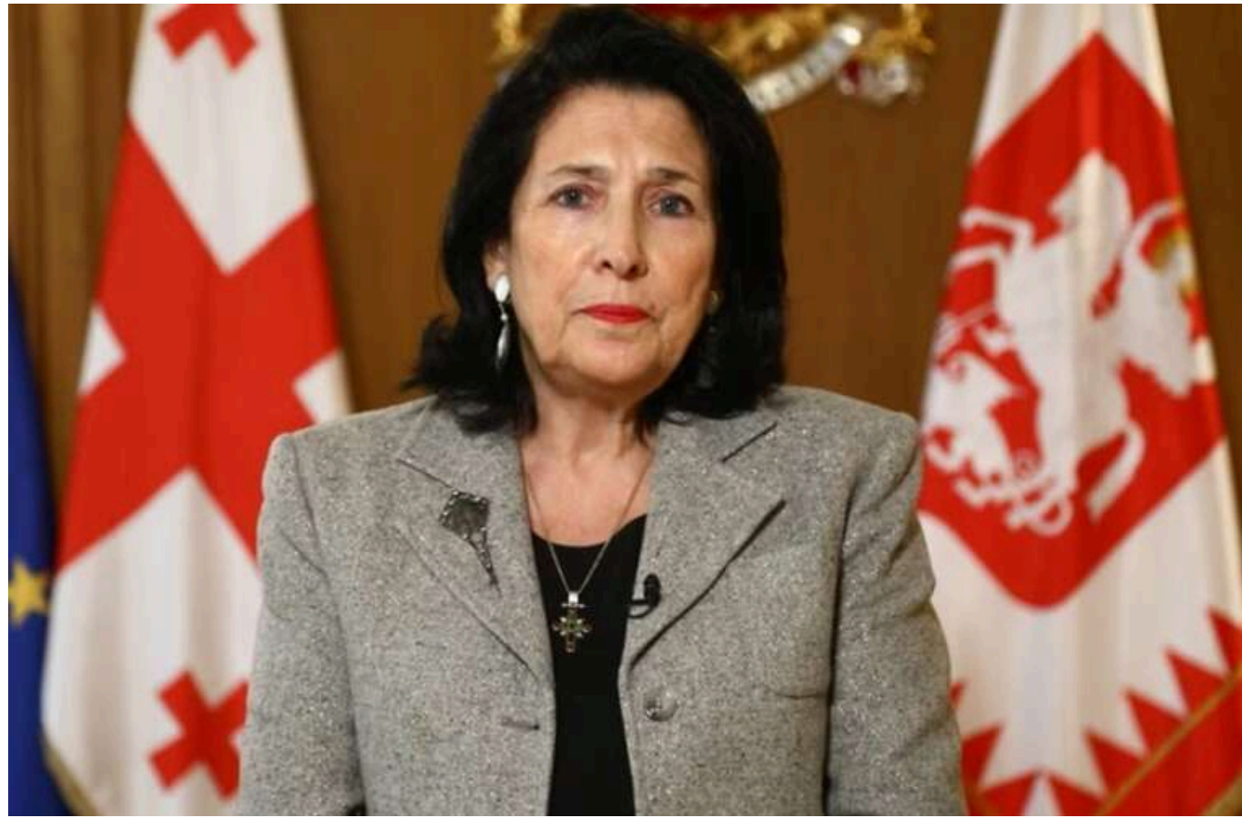
Зурабішвілі не визнала вибори у Грузії та закликала до протесту

Президентка Грузії Саломе Зурабішвілі не визнала вибори. Вона закликала громадян до протесту.