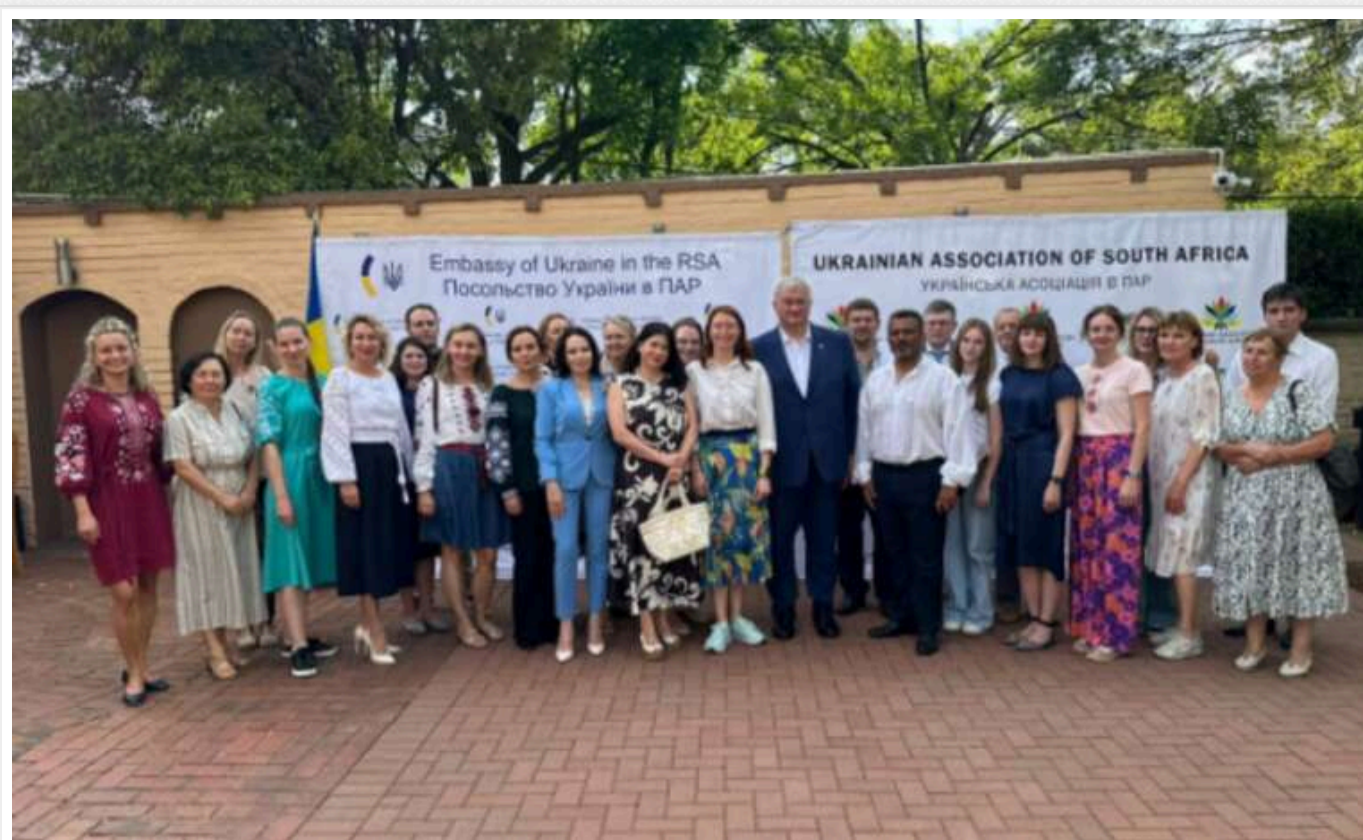
Сибіга розпочав свій візит до ПАР із зустрічі з українською громадою

Міністр закордонних справ України Андрій Сибіга під час свого візиту до Південно-Африканської Республіки зустрівся з українською діаспорою.