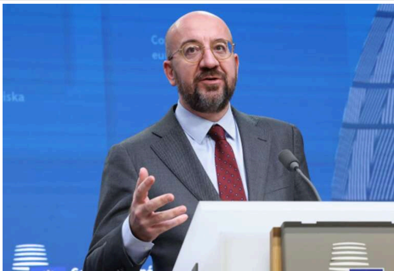
Голова Європейської ради закликав провести розслідування порушень на виборах у Грузії

Голова Європейської ради Шарль Мішель закликає владу Грузії розслідувати порушення на парламентських виборах.