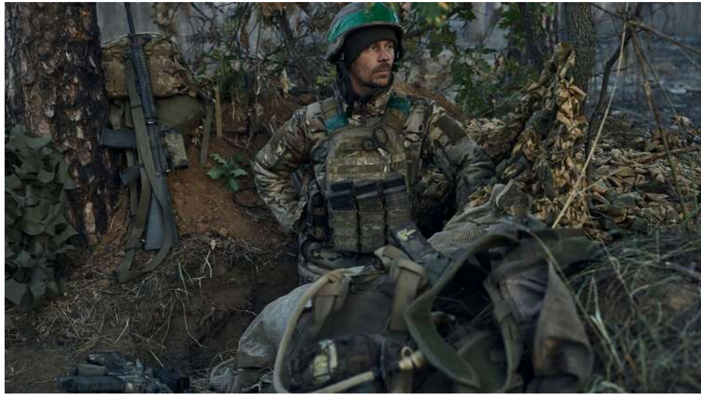
ЗСУ на Курахівському напрямку відійшли з трьох населених пунктів

На Курахівському напрямку в Донецькій області бійці ЗСУ залишили місто Гірник через тамтешню складну оперативну обстановку.