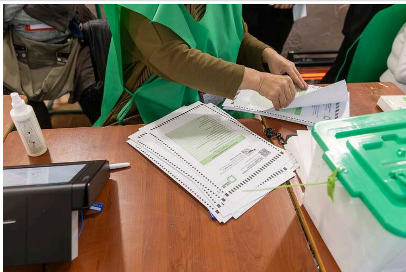
У Раді прокоментували вибори в Грузії

Результати виборів до парламенту Грузії, що відбулися 26 жовтня, вказують на те, що країна наближається до примирення з країною-агресоркою Росією. Також виникають сумніви щодо чесності та демократичності голосування.