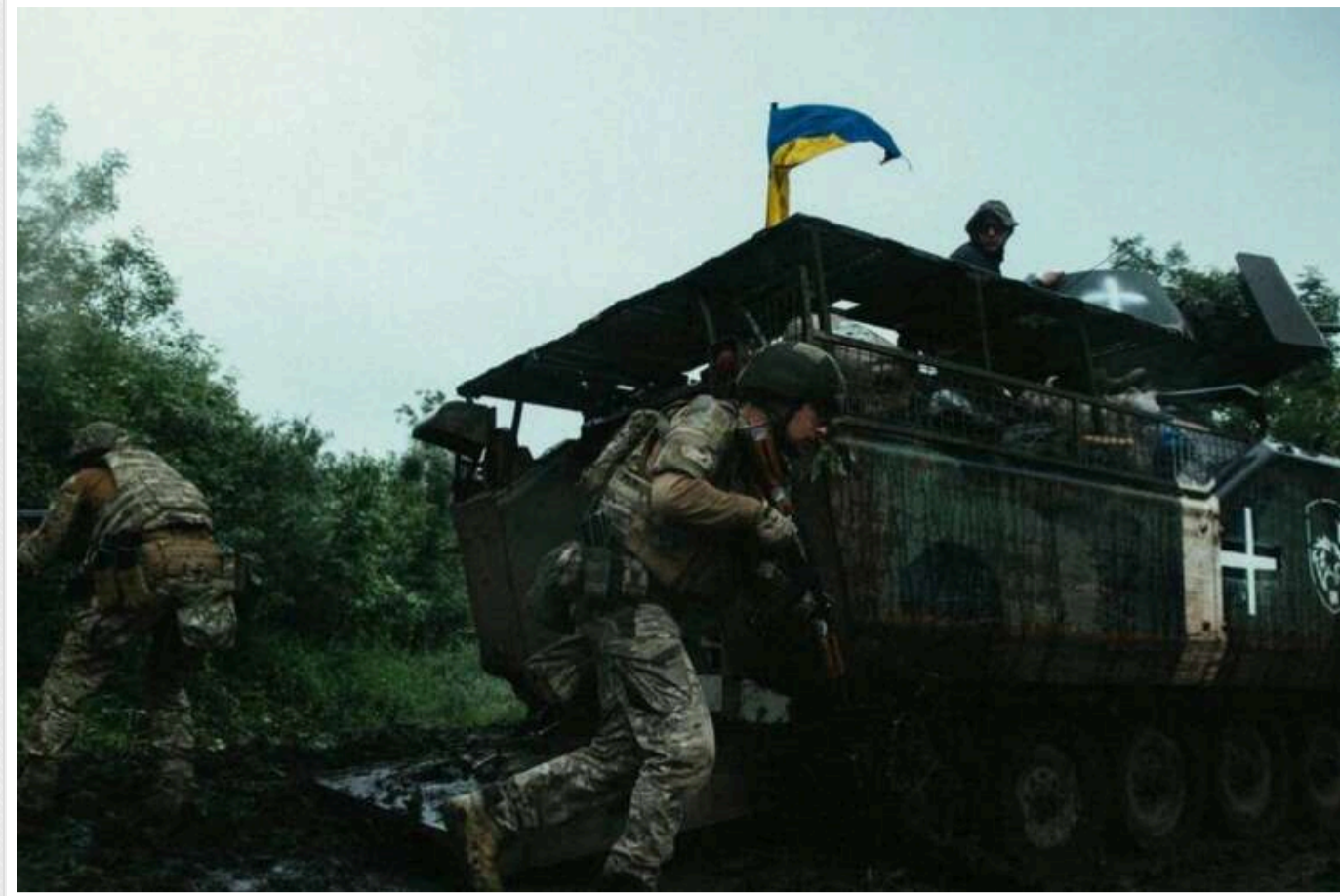
У 3-й штурмовій показали, як знищують окупантів на Харківщині

Українські військовослужбовці продовжують знищувати особовий склад російської армії на Харківському напрямку. Загарбників виганяють з підвалів, сараїв та земляних укриттів.