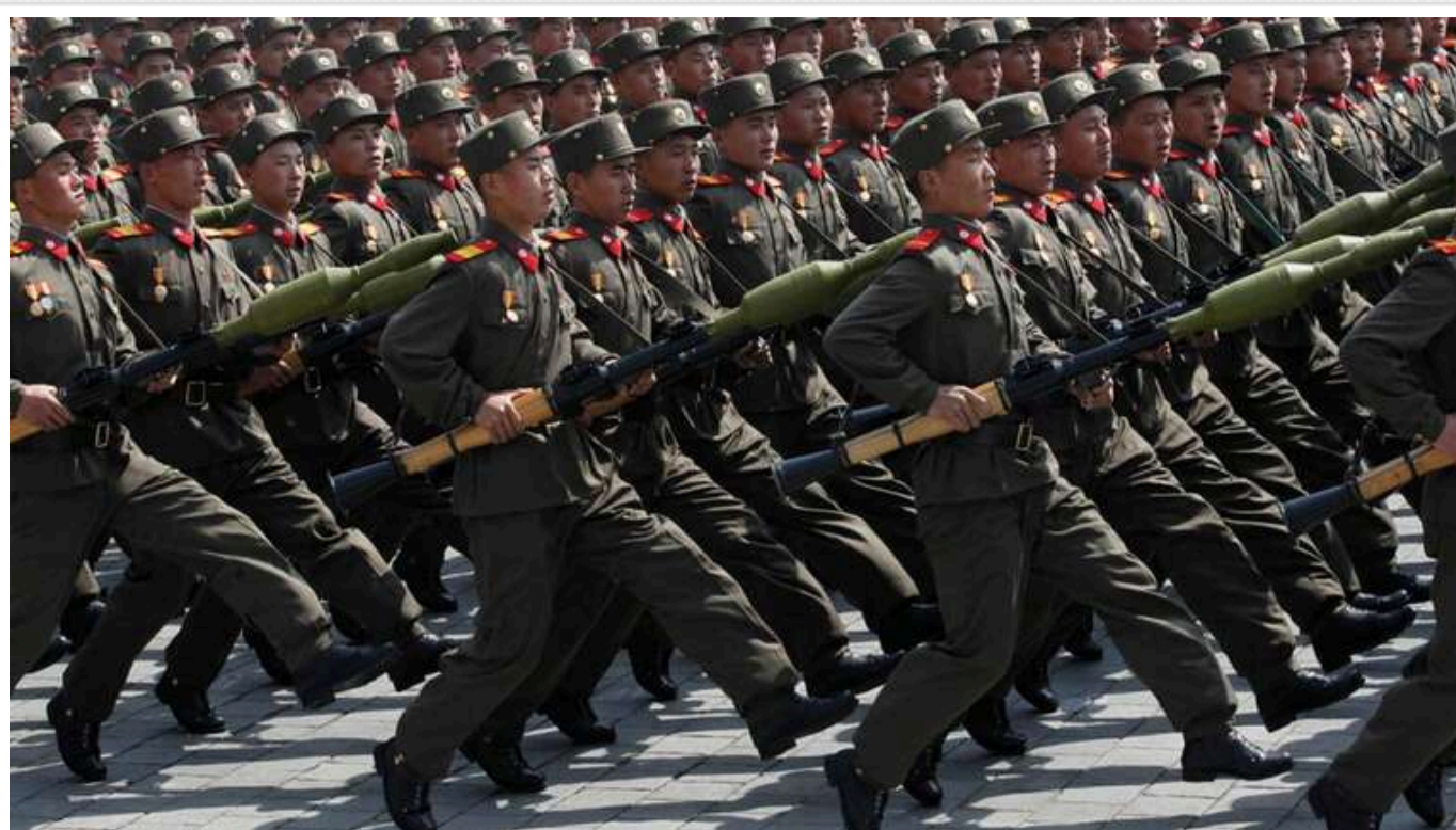
WSJ: Кім Чен Ин відправив на фронт не найкращі сили

Війська КНДР, які підходять до російсько-українського фронту, можливо, не є найсильнішими та найкращими представниками армії Кім Чен Ина. Згідно з відео та даними розвідки, ймовірно, це молоді люди у віці від підлітків до 20 років, які перебувають на початкових етапах військової служби.