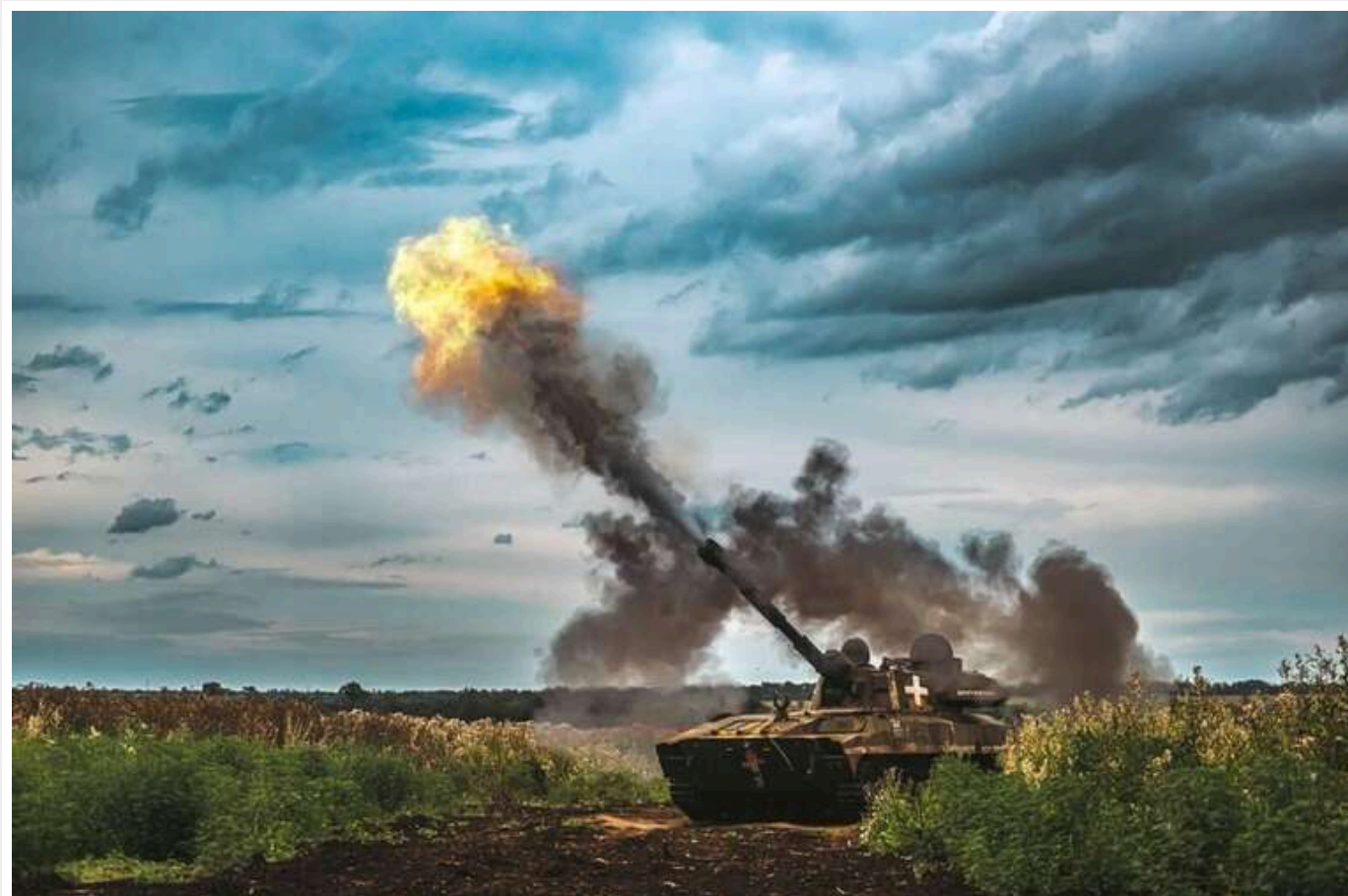
Які кроки, за думкою західних аналітиків, повинні вжити Україна та Захід, щоб ефективно протистояти загарбникам у 2025 році

Якщо війна в Україні продовжуватиметься в тому ж дусі, що зараз, то у 2025 році на Київ чекатиме поразка, вважає низка провідних американських експертів.