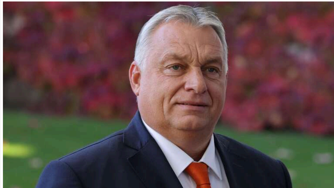
Орбан планує відвідати Грузію, де назрівають протести через "вкрадені вибори"

Віктор Орбан, прем'єр-міністр Угорщини, яка зараз очолює ЄС, планує візит до Грузії в понеділок після виборів, на яких як проєвропейська опозиція, так і партія влади заявили про свою перемогу.