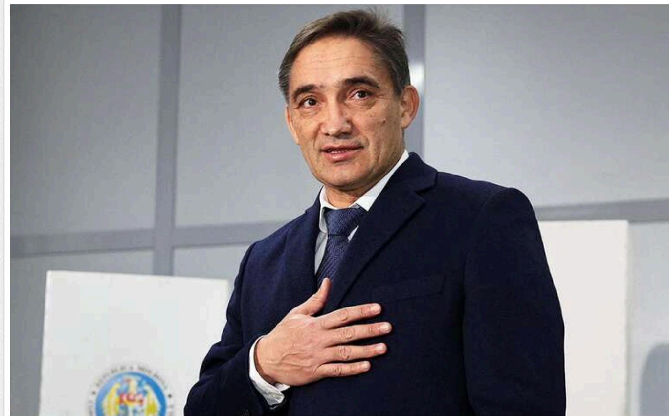
Суперник Санду пояснив, як формуватиме відносини з Україною, якщо стане президентом

Кандидат у президенти Молдови від проросійської Соціалістичної партії Молдови Олександр Стояногло заявив, що підтримує Україну у війні проти Росії, і за його президентства відносини між двома державами тільки зміцніють.