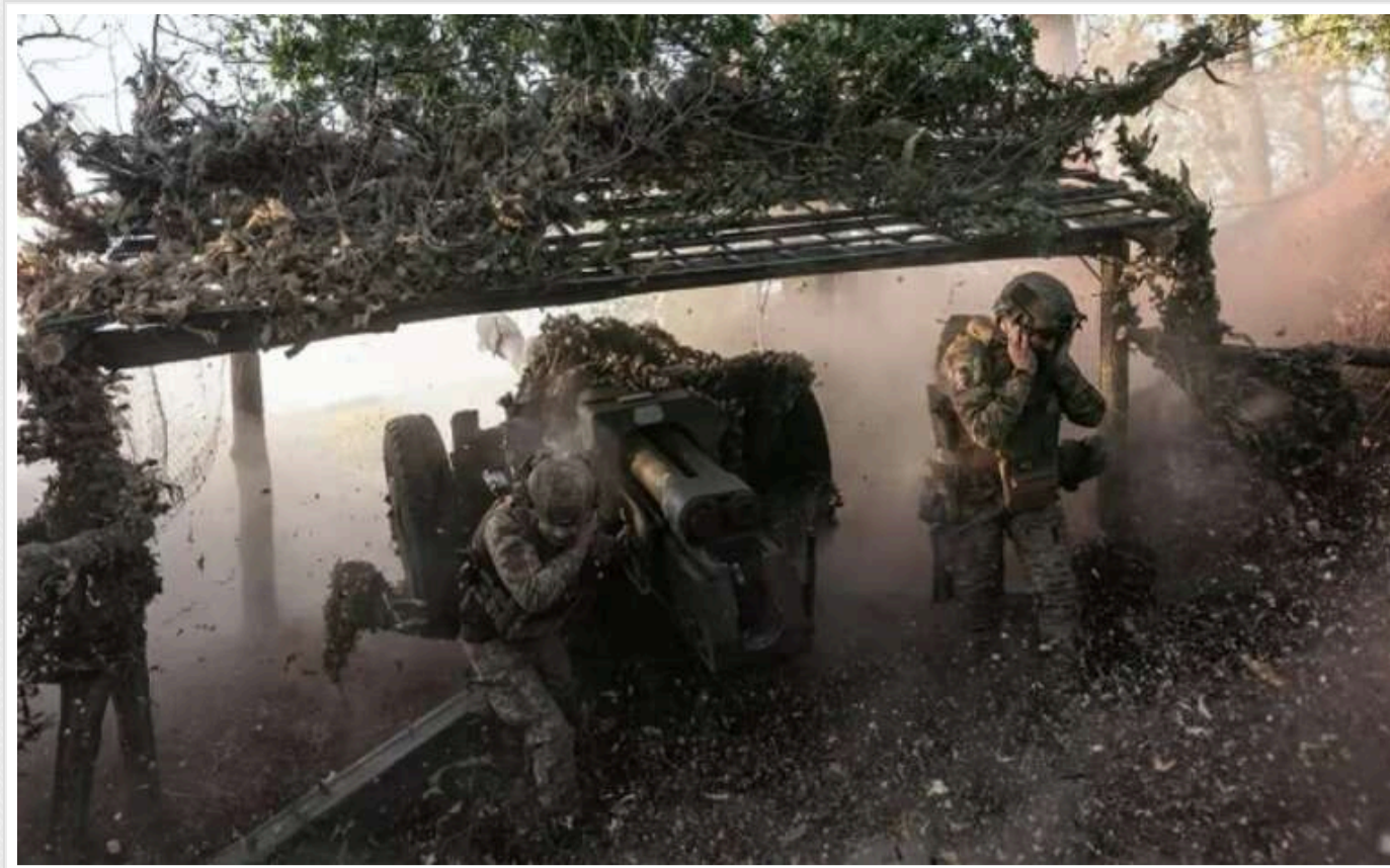
Ситуація на фронті: росіяни намагаються прорвати оборону біля Селидового

Згідно з даними Генерального штабу, ситуація на фронті залишається важкою, з початку доби відбулося 84 бойових зіткнення. На Покровському напрямку захисники вже відбили 10 атак, зокрема біля Селидового, на Курахівському напрямку зупинено 19 штурмів противника.