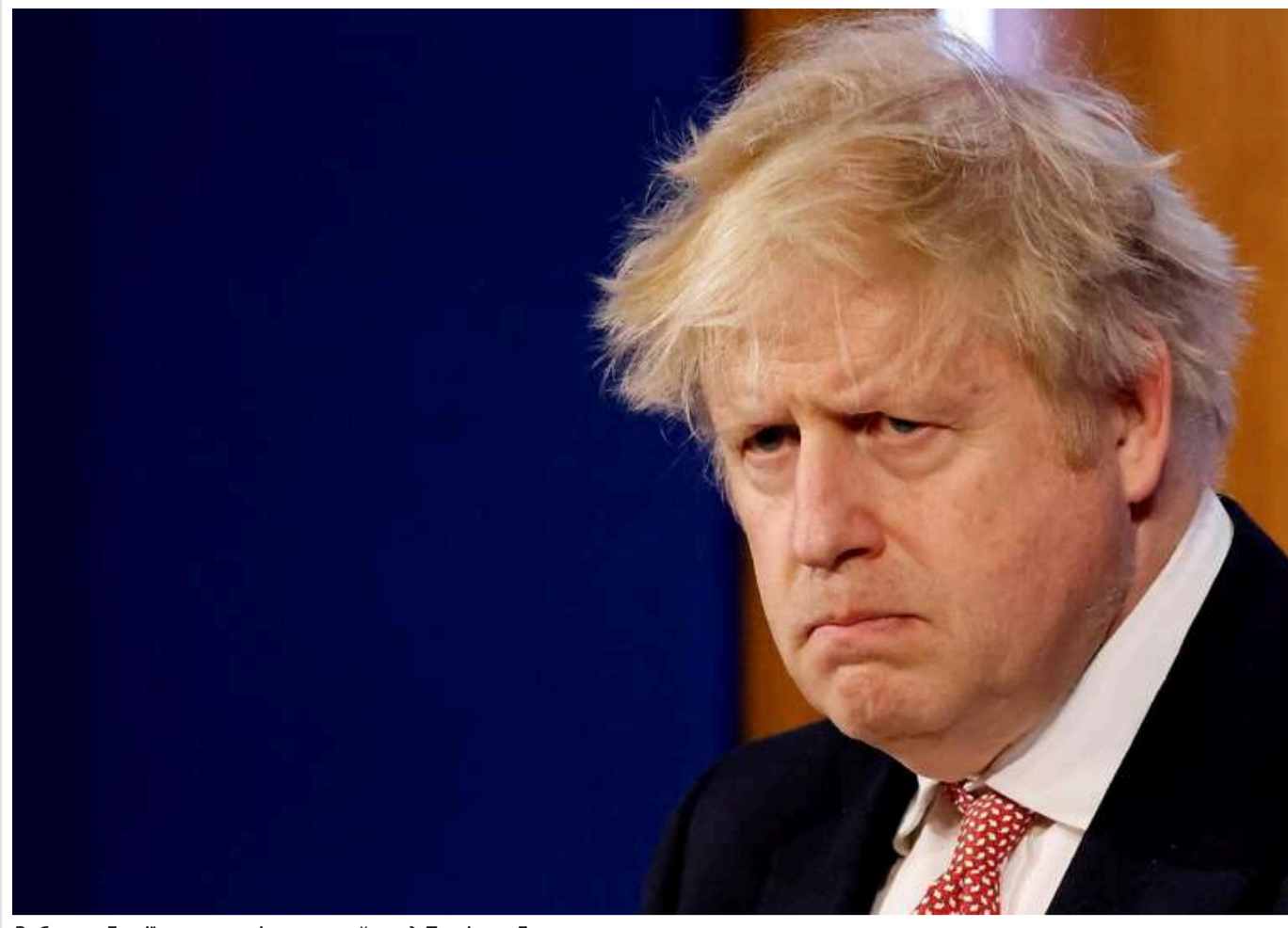
Вибори в Грузії вкрав маріонетковий уряд Путіна, - Джонсон

Колишній прем'єр Британії Борис Джонсон заявив, що парламентські вибори в Грузії, які відбулися 26 жовтня, були вкрадені маріонетковим урядом Володимира Путіна у Тбілісі.