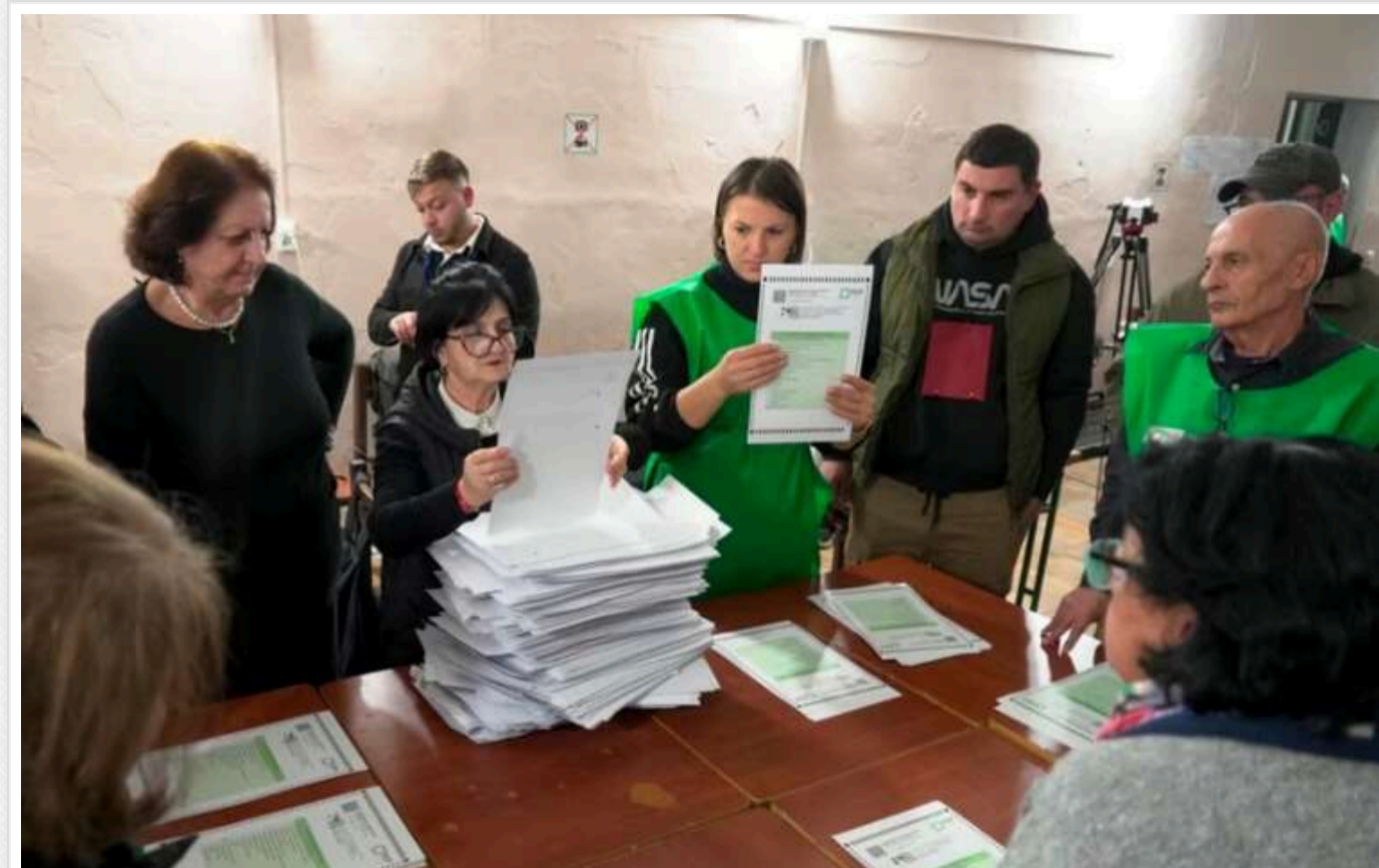
У Європі і Канаді закликали ЄС не визнавати результат виборів у Грузії

Видатні парламентарі європейських країн, а також Канади вважають, що парламентські вибори в Грузії 26 жовтня не відповідали критеріям свободи й справедливості, тому Європейський Союз не повинен визнавати їхні результати та має запровадити персональні санкції.