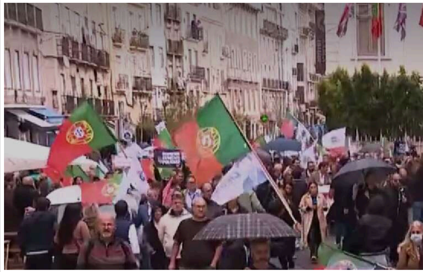
У Лісабоні тисячі людей протестували проти насильства поліції

Тисячі людей вийшли на головний проспект у центрі Лісабона в суботу, щоб висловити протест проти поліцейського насильства.